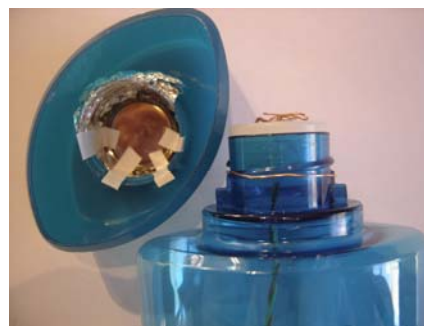
Fig. 3. Armado final del dispositivo.