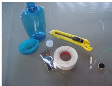
Fig. 1. Materiales a utilizar en la construcción del dispositivo.

En la Figura 1 se muestran los materiales necesarios para el armado del DLI, los cuales son: un recipiente transparente de color con tapa; una lámpara tipo led de color contrastante con respecto al recipiente, una pila botón de 3V, papel aluminio, cables y cinta aisladora. En la Figura 2 se muestra la preparación del led y de la conexión correspondiente a la tapa del recipiente, en esta instancia se unen los cables a los contactos del led envolviendo los empalmes con cinta aisladora y cuidando que no hagan contacto entre sí. Se enroscan los cables y se pasan a través del agujero de la tapa dosificadora. En la Figura 3 puede observarse el detalle del armado del circuito. Los cables deben disponerse de tal forma que entren en contacto con los polos de la pila cuando las dos partes componentes del DLI se unen.