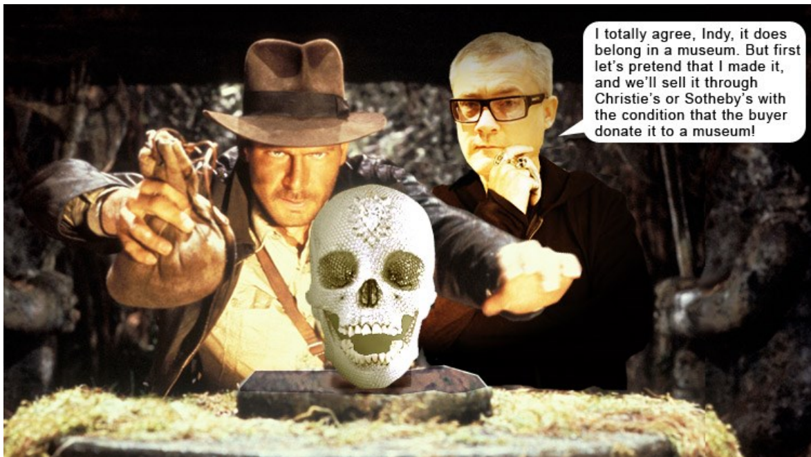
Fig. 2: Meme

http://www.damienhirst.com/for-the-love-of-god