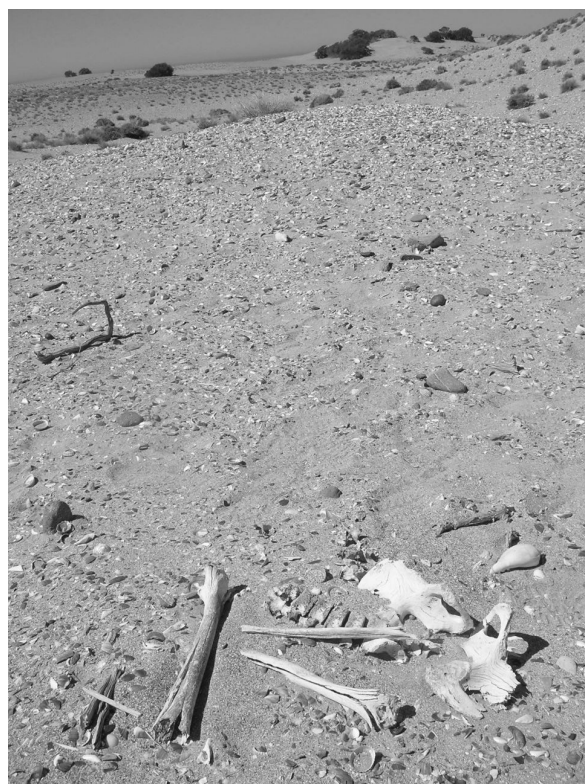
Fig. 2. Fotografía del entierro Punta Buque 3.

El estudio del sedimento asociado al entierro se realizó en el IGS-CISAUA (Instituto de Geomorfología y Suelos-Centro de Investigaciones en Suelos y Agua de uso agropecuario, perteneciente a la Universidad Nacional de La Plata). Las variables analizadas fueron contenido porcentual de materia orgánica