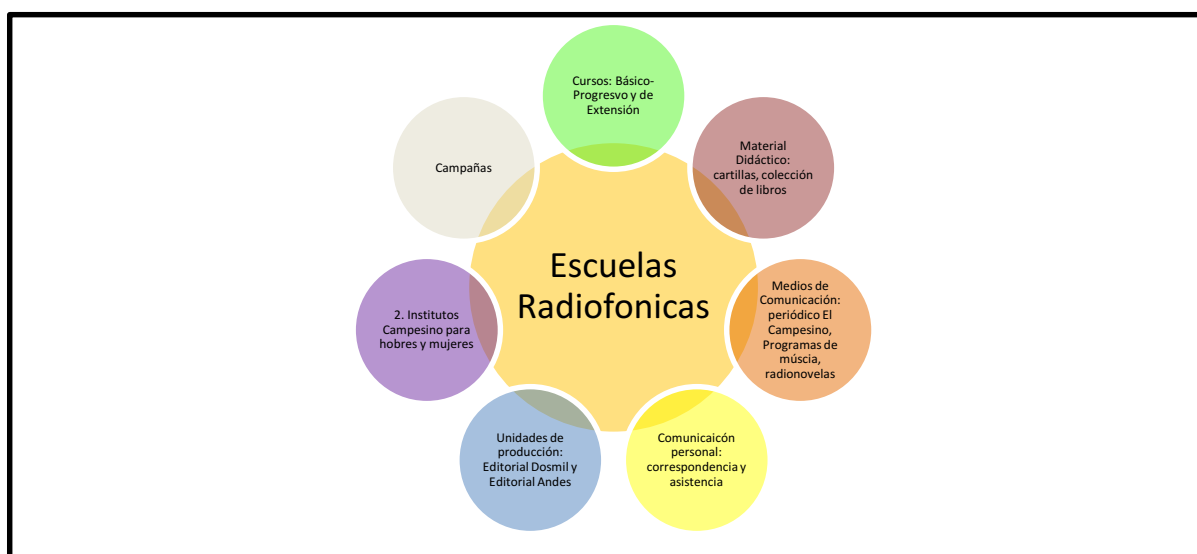
Figura 3. Modelo Comunicativo Educativo

Editorial Andes: Unidad de producción de ACPO donde se imprimían todos los materiales de la Institución, debido a su gran montaje y capacidad técnica, se convirtió en la principal fuente de autofinanciación del programa de Acción Cultural Popular.