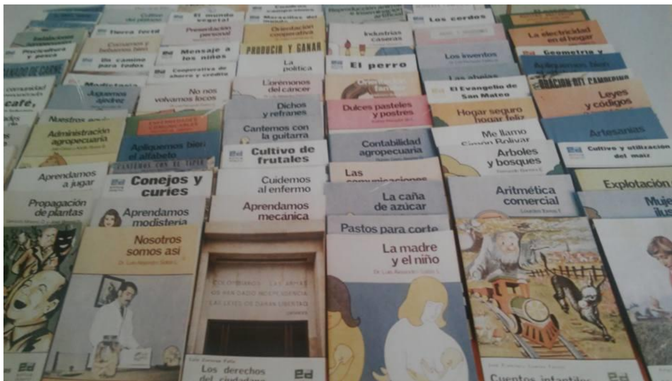
Figura 5. Afiche ubicado en el Hotel Belvedere de Sutatenza.