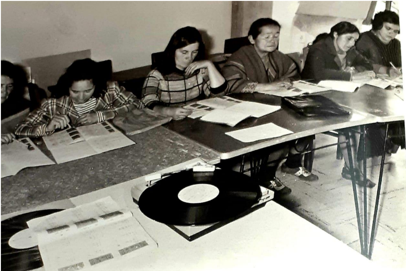
Figura 6. Fotografía “Aprendizaje a través de Disco Estudio, curso básico de lectura y escritura” en el Boletín Cultural y Bibliográfico del Banco de la República (2012, p. 12)