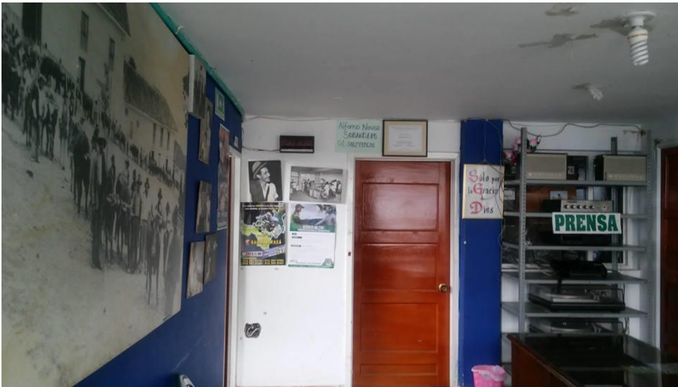
Figura 7.