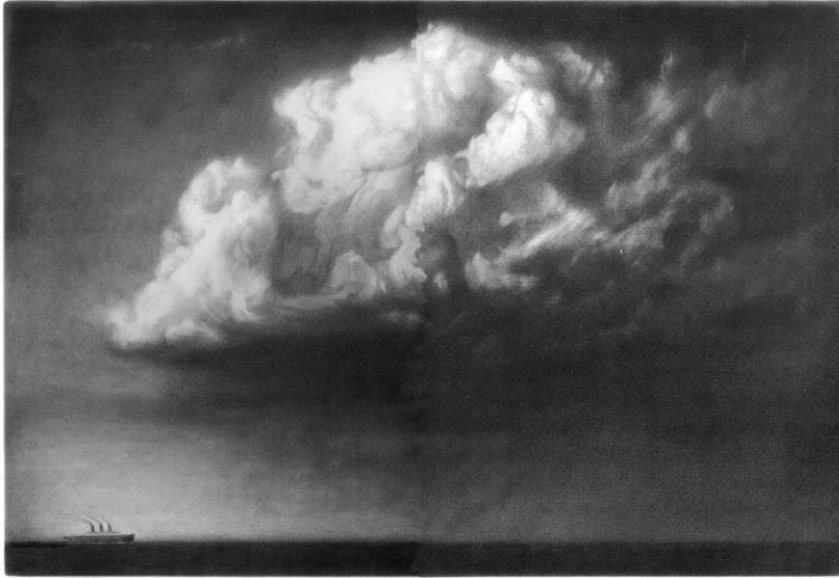
Shaun Tan, Emigrantes, 2006

Creo que el gran problema de nuestro tiempo es resolver las tensiones entre naturaleza y cultura, y esto no solo es un problema ecológico, sino también espiritual, entendiéndonos a nosotros mismos como animales en un planeta compartido. 7