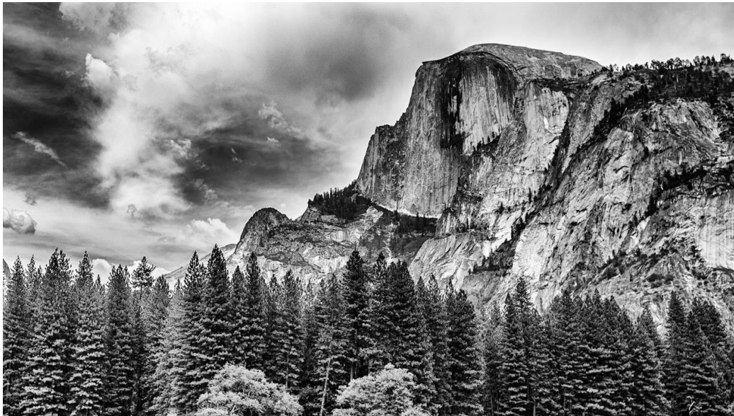
Ansel Adams, Clouds over Half Dome, 1960

Sus imágenes monocromáticas no son documentos “realistas” de la naturaleza. En cambio, propone una intensificación y purificación de la experiencia psicológica de la belleza natural. Ha creado un sentido sublime de la magnificencia de la naturaleza que infunde al espectador con el equivalente emocional de la naturaleza salvaje, muchas veces más poderoso que la experiencia de la realidad. 6