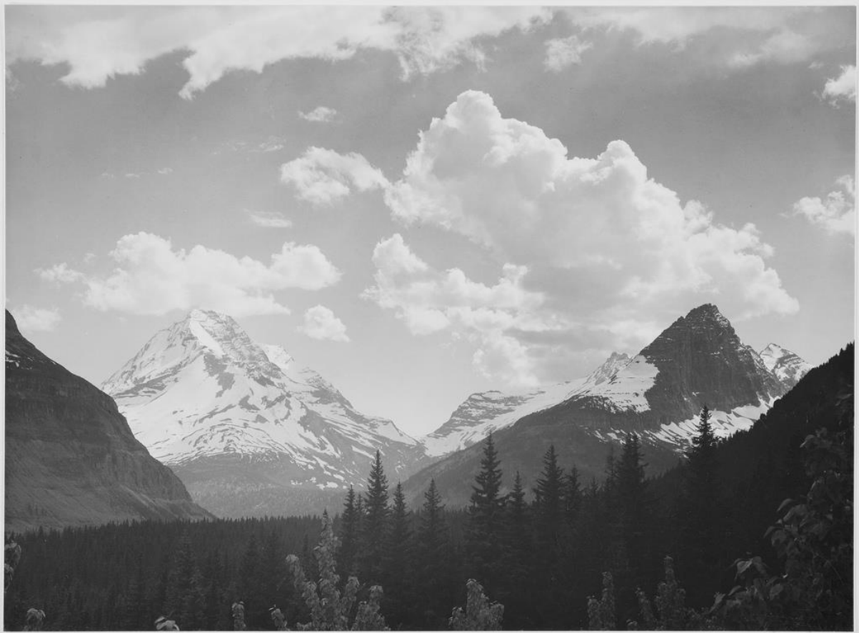
Ansel Adams, Looking across forest to mountains and clouds, 1933