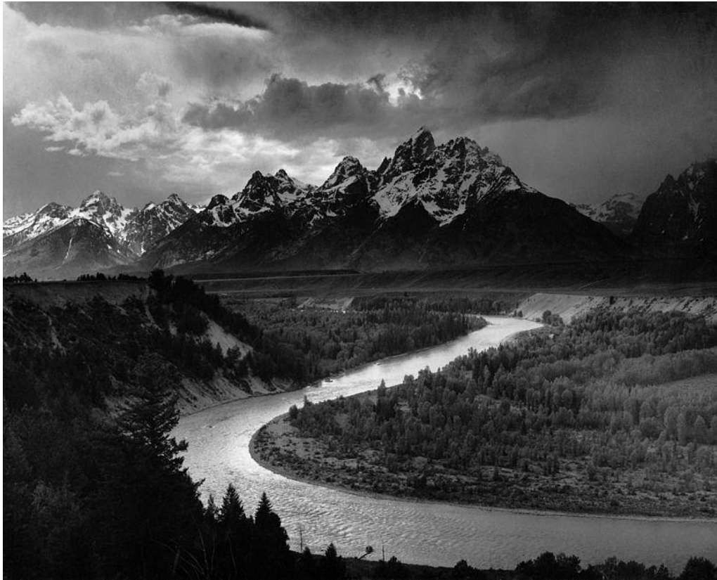
Ansel Adams, The Tetons and the Snake River, 1942