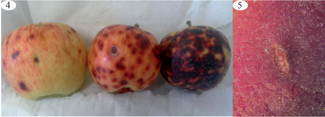
Figs. 4 y 5. 4, frutos con distinto nivel de daño. 5, postura endofítica en fruto (ampliada).

hojas y yemas aledañas no presentaron lesiones.