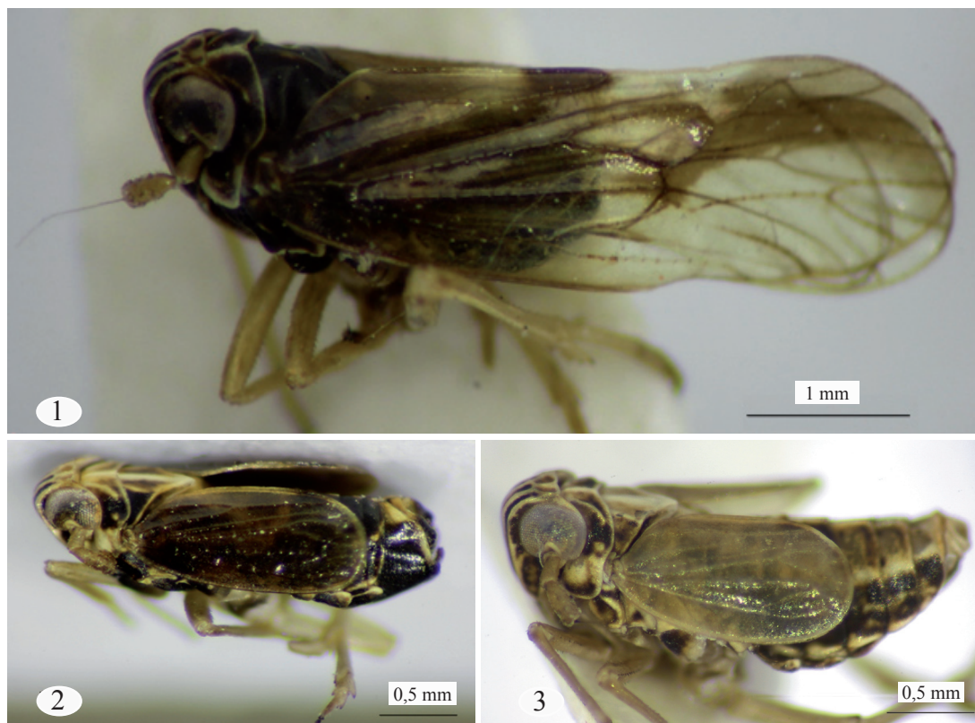
Figs. 1-3. 1, Macho macróptero Vista lateral. 2, macho braquíptero Vista lateral. 3, Hembra braquíptera Vista lateral.

ma del aedeagus del macho y de la escama genital de la hembra (Guglielmino et al , 2016).