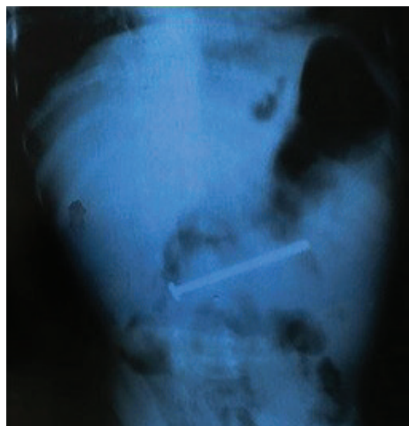
FIGURA 1. Radiografía: Cuerpo extraño radiopaco en la región centroabdominal, compatible con un tornillo

Lactante masculino de 10 meses, que consultó por manifestaciones respiratorias de 3 días de evolución. En el examen físico al momento del ingreso, se constataron signos de hipoxia y obstrucción bronquial y ausencia de otras manifestaciones de importancia. Se realizaron estudios de laboratorio con resultados positivos para el virus sincicial respiratorio y ausencia de elevación de reactantes de fase aguda. Se efectuó el diagnóstico de bronquiolitis. Por la persistencia de las manifestaciones clínicas, se realizó una radiografía toracoabdominal, que mostró infiltrado intersticial bilateral y, como hallazgo, un cuerpo extraño radiopaco compatible con un tornillo de 7 cm de longitud, localizado en la región centroabdominal (Figura 1).