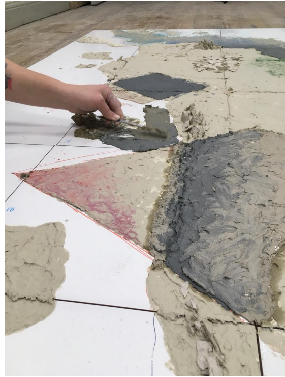
Proceso de trabajo sobre la obra final