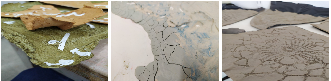
Pruebas realizadas en pasta de papel