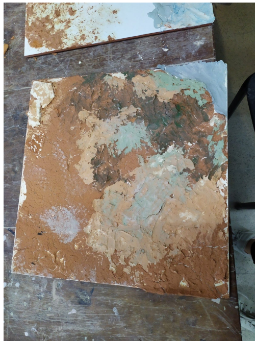
Cerámico terminado luego de la horneada