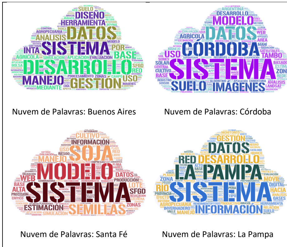
Esta visualización de datos es indicada para una interpretación clara e rápida, na qual é possível observar as palavras mais frequentes em cada caso durante o período 2008-2018.

Na Figura 2, pode-se observar as nuvens de palavras de cada Província.