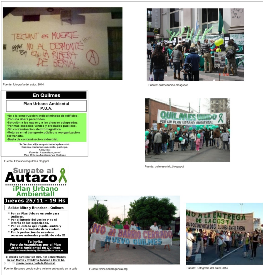
Figura 3. Actores reactivos en Quilmes.