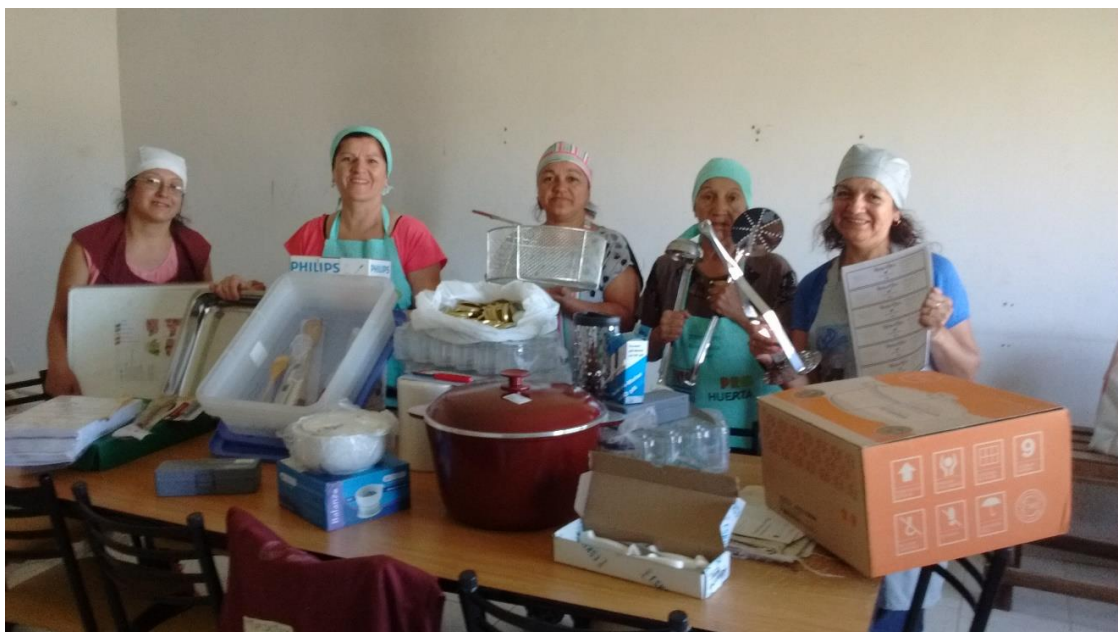
Figura 3. Moras Brix en la cocina del CIC