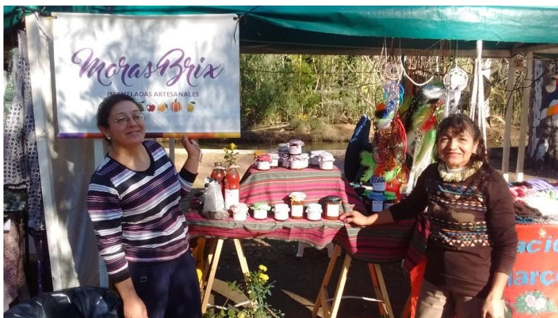
Figura 2. Moras Brix en la Feria del Lago (Parque de Mayo, Bahía Blanca)

Fuente. Foto tomada por M. Celina Diotto. Octubre 2017