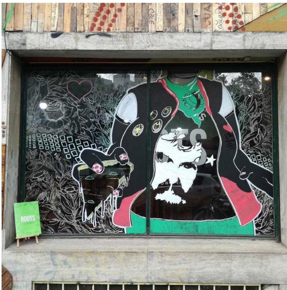
Figura 6. Mural en la fachada de pizzería Roots, diagonal 73 y 56, La Plata, 2017.