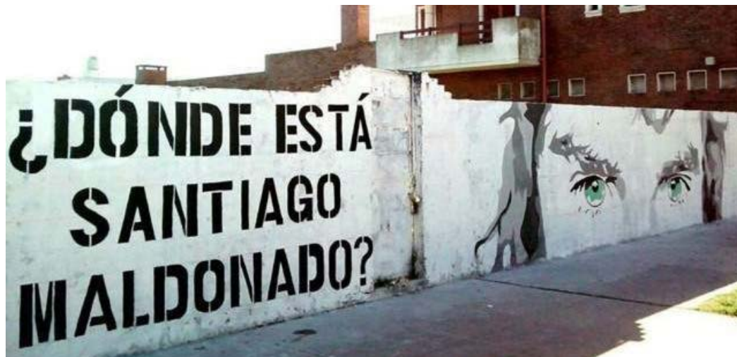
Figura 4. Mural producido por la Mesa de la Memoria de San Nicolás y el Colectivo Arquitectura del sur de Rosario, calles Chacabuco y Olleros, 1 de septiembre de 2017.