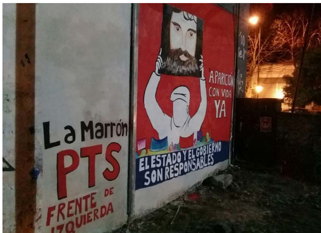
Figura 7. Mural colectivo en el centro de Los Hornos, realizado por estudiantes terciarios, docentes y trabajadores, calles 137 y 60, La Plata, 2017.

Si los posicionamientos políticos de esta pizzería a través de sus artículos en internet eran destacados por su singularidad en el mercado —téngase en cuenta que un usuario comentó “iba a pedir una pizza y cuando vi esta asquerosa página que en vez de ofrecer un producto gastronómico ofrece solo propaganda política me arrepentí!! que tiene que ver la pizza con Maldonado o el aborto? Detestable!!!!” (Facebook 2018)—, la apropiación de la imagen de Maldonado en su propia fachada acentúa el carácter contestatario mantenido en la red social. Además, es interesante destacar que en el mural la imagen de Maldonado surge en la ropa de una persona que la porta, quien, al mismo tiempo, tiene colocado el característico pañuelo utilizado en la lucha social por la legalización del aborto. Esta persona aparece ofreciendo una porción de pizza. La llamativa combinación de elementos que expresa este mural lo hace único en el contexto del reclamo por la desaparición de Maldonado.