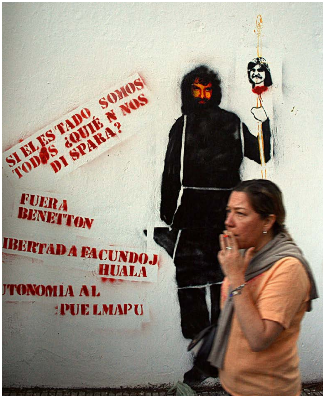
Figura 2. Stencil callejero, Ciudad de Buenos Aires, agosto de 2017.

existencia de lo común, lo que separa y excluye, por un lado, y lo que hace participar, por otro. De esta forma, la policía da cuenta de la distribución jerárquica de nombres, lugares, espacios y funciones, que los naturaliza y legitima, define lo que es visible y lo que no lo es, quiénes pueden hablar y quiénes no, y así dañan la igualdad de los que integran lo común. La política se identifica con la parte de los que no tienen parte, aquellos que aparecen y subvierten la división de los lugares y de las funciones. Para este autor, solo hay política cuando las maquinarias del orden policial son interrumpidas por el efecto del supuesto de la igualdad de cualquiera con cualquiera. La igualdad así pensada es, entonces, más que un principio o valor, el operador de una diferencia: ¿realmente somos todos iguales?, ¿entonces por qué algunos no pueden decir, hablar?, ¿por qué entonces a algunos se les dispara?