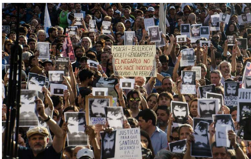
Figura 3. Fotografía de la marcha en Buenos Aires por la desaparición de Santiago Maldonado, 2017.

En las distintas marchas en las que se reclamaba por la aparición con vida de Santiago y justicia en relación con el hecho, han circulado frases como “El Estado es responsable”, “El Gobierno sabe dónde está”, “Macri-Bullrich-Noceti-Gendarmería. El negarlo no los hace inocentes. Ni olvido ni perdón”. Aquí el Estado nacional en general y los representantes de los poderes públicos en particular (el presidente, la ministra de Seguridad Nacional, la Gendarmería) aparecen de forma manifiesta como un “otro” antagonista culpable de la desaparición —y posterior muerte— de Maldonado (figura 3).