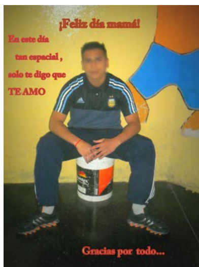
Figuras 4 y 5

Como siempre, están con sus mejores ropas de estilo deportivo que son las permitidas por los reglamentos internos y bien afeitados 12 . El plano elegido, en su mayoría, es el plano entero donde se muestran por completo, especialmente la vestimenta y el calzado, una preocupación constante que muestra el nivel de manejo de dinero que, tratándose de adolescentes que provienen de sectores muy pobres de las localidades populosas del conurbano bonaerense, puede ser leído como una pretensión a estar en una posición jerarquizada, en directa relación con el nivel de destreza en el mundo delictivo. Solo algunos eligen el plano americano dejando mucho espacio arriba para escribir allí. En estos casos, la gestualidad de las manos será protagonista.