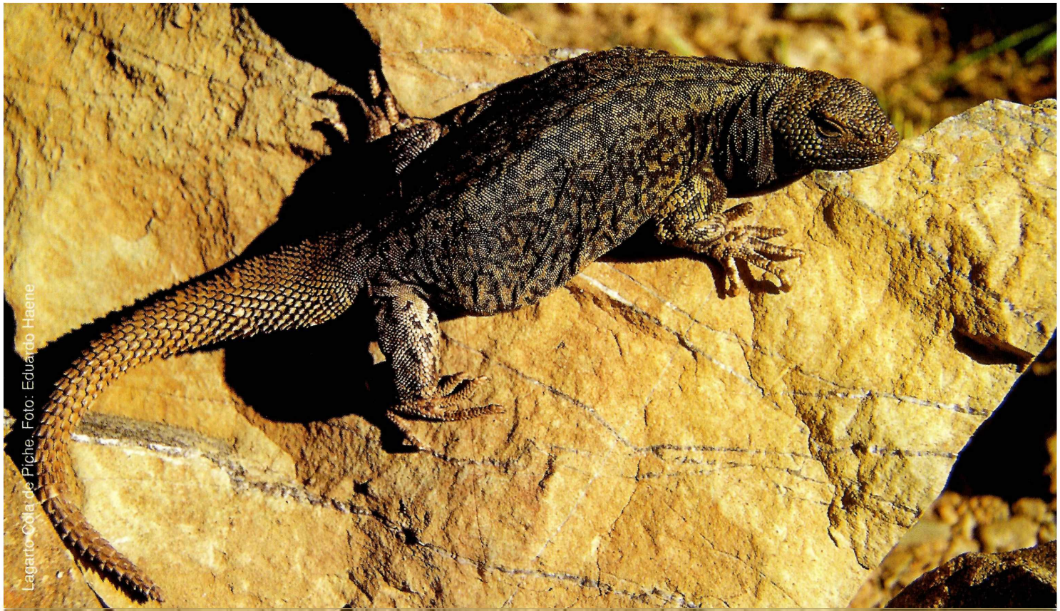
Lagarto Cola de Piche.

“El hombre no fue educado para destruir sino para convivir con todos los animales y plantas. Incluso con los que le inspiran una aversión ancestral”.