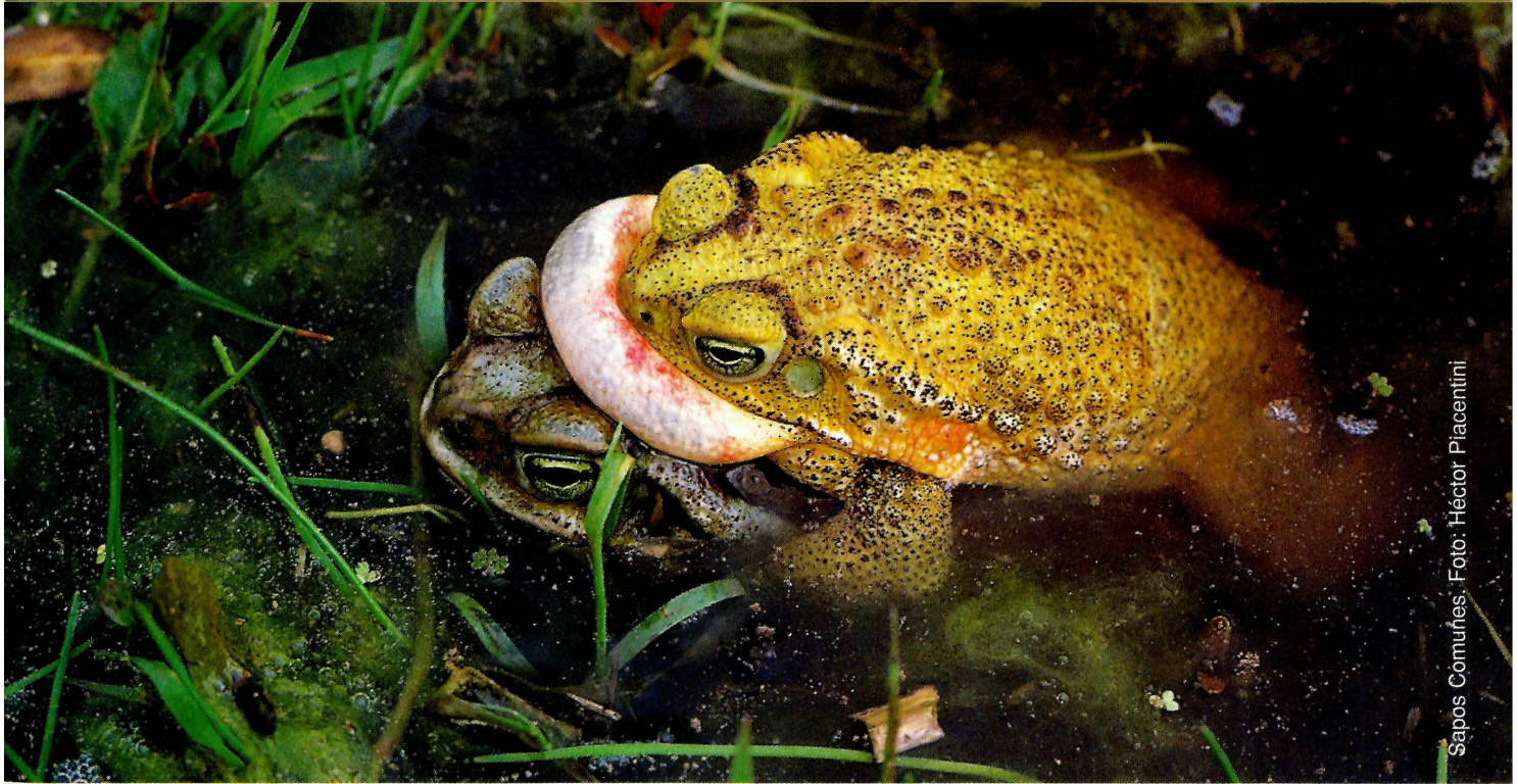
Sapos Comunes.