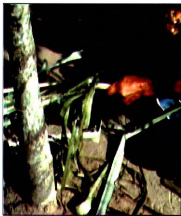
Fig. 3. Descarnado de una hoja de D. urbanianum por fricción.

Cuando carecían de otros elementos tecnológicos, los aborígenes del Chaco empleaban como cordeles fibras vegetales y cueros. Con esta