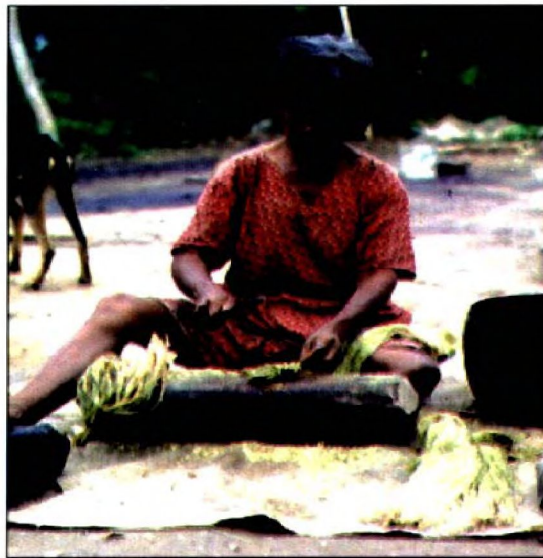
Fig. 5. Macerado de fibras de B. hieronymi .

materia prima construyeron una gran cantidad de implementos para satisfacer sus necesidades. Los ámbitos de la vida donde cumplen funciones los objetos preparados con las fibras de las bromeliáceas se fijan del siguiente modo: utilitario, festivo y expresivo-ornamental. Algunos de los objetos que se usaron antiguamente y que aún se