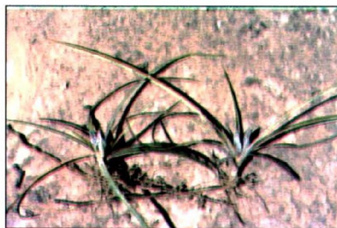
Fig. 1. Planta de Deinacanthon urbanianum .

A partir de estos hilos fabrican un conjunto importante de utensilios, que tuvieron relevancia en el pasado. En la actualidad estos pueblos incorporaron en el mercado de artesanías diversos materiales que gozan de mucha aceptación: cortinas, tapices, caminos de mesa,