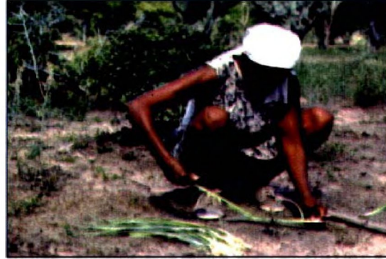
Fig. 4. Pelado a mano de hojas de B. hieronymi .

materia prima construyeron una gran cantidad de implementos para satisfacer sus necesidades. Los ámbitos de la vida donde cumplen funciones los objetos preparados con las fibras de las bromeliáceas se fijan del siguiente modo: utilitario, festivo y expresivo-ornamental. Algunos de los objetos que se usaron antiguamente y que aún se