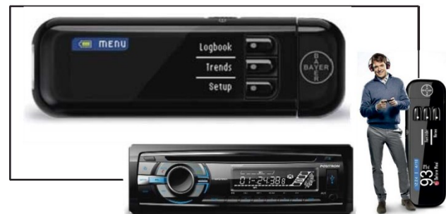
Referentes simbólicos de la época

Lanzado en el 2010. Dónde a simple vista se puede percibir el producto como un objeto que claramente se relaciona con la reproducción de música portátil, de hecho, mantiene prácticamente los mismos rasgos formales con reproductores de mp3 y también comparte rasgos, aunque no tan marcados, con estéreos para vehículos (Figura 4).