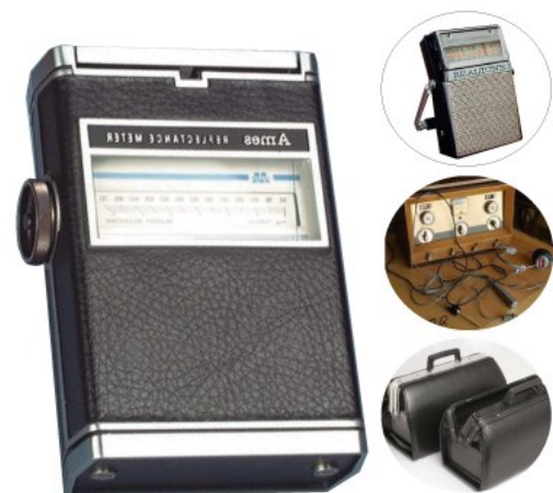
Referentes simbólicos de la época

En términos formales, tenemos el cuerpo principal y en su lateral se adiciona el comando para ajustar la lectura de la tira reactiva, esto junto con los materiales utilizados responden a las tecnologías disponibles en este contexto y también