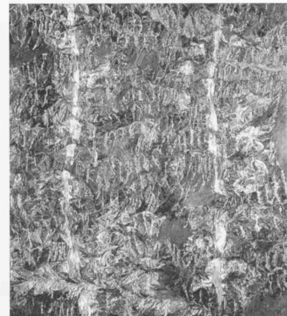
Izquierda: Museo Guggenheim de Frank Gehry. Derecha: obra de Therese Oulton.

Nota: las imágenes fueron provistas por el autor.