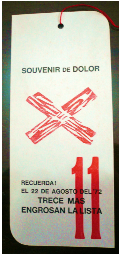
Figura 3a. E. A. Vigo Señalamiento 11 Souvenir del dolor, 1972.

institución arte en esa década. En algunos señalamientos, a través de la búsqueda de conmoción del régimen de lo sensible, Vigo no apela directamente a politizar la práctica habitual generando “conciencia” (social, política), pero propone interpelar la vivencia acostumbrada. En otros, aparecen mencionados hechos políticos y son éstos los señalados. Algunos casos de éstos son las múltiples referencias que hace el artista a la “Masacre de Trelew”, tal como lo hace en el Señalamiento 11, aludiendo a ese hecho y colocando en el reverso una imagen cortada y calada en el ojo de Ernesto “Che” Guevara, figura referente de la juventud militante de los años '60 y '70 (fig. 3 a y b). A través de sus acciones, Vigo participa del proceso de radicalización que se estaba viviendo, pero conservando en casi todos los casos rasgos materiales de la serie, como la flecha que señala y la utilización de materiales no convencionales, así como –salvo en algunas excepciones– un mensaje que tiene algo velado y que el propio espectador deberá interpretar, esquivando así el tipo de mensaje propagandístico.