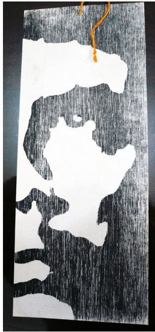
Figura 3b. E. A. Vigo Señalamiento 11 Souvenir del dolor (reverso), 1972.

La utilización del lenguaje judicial-administrativo en algunas de sus obras y acciones es el tercer aspecto a analizar. Vigo usó sellos y frases típicas de este lenguaje y más allá de que esto pueda remitirse a su trabajo como empleado de los Tribunales, esta utilización merece ser analizada (Fig. 4).