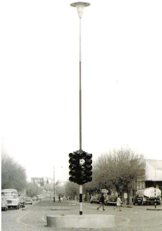
Figura 2. E. A. Vigo, Señalamiento “Manojo de semáforos”, 1968.

Una de las particularidades de estas y otras acciones en el espacio público es que el autor proyectó su ubicación en ese espacio, a diferencia de otras acciones artísticas que sólo son trasladadas del museo o la galería. Es decir que apuntaba a la vinculación con un público más amplio que el de los sitios específicos del campo artístico. Otro de los aspectos destacados es que en la construcción de estas acciones utilizó elementos urbanos, como el semáforo, el monumento, la vereda y el mapa. La incorporación de objetos existentes en las obras de arte ya venía siendo utilizada desde hacía décadas, cuyo resultado había sido un cuestionamiento radical de los roles del artista como autor y de la obra como pieza artística (encontramos el antecedente principal en los ready-made de Duchamp), y en este caso, Vigo retoma esa línea al emplear elementos tales como un monumento, un semáforo, una vereda con la construcción de sus señalamientos, y expresa públicamente la intención de generar un extrañamiento en relación con esos objetos, desencajarlos de su cotidianeidad