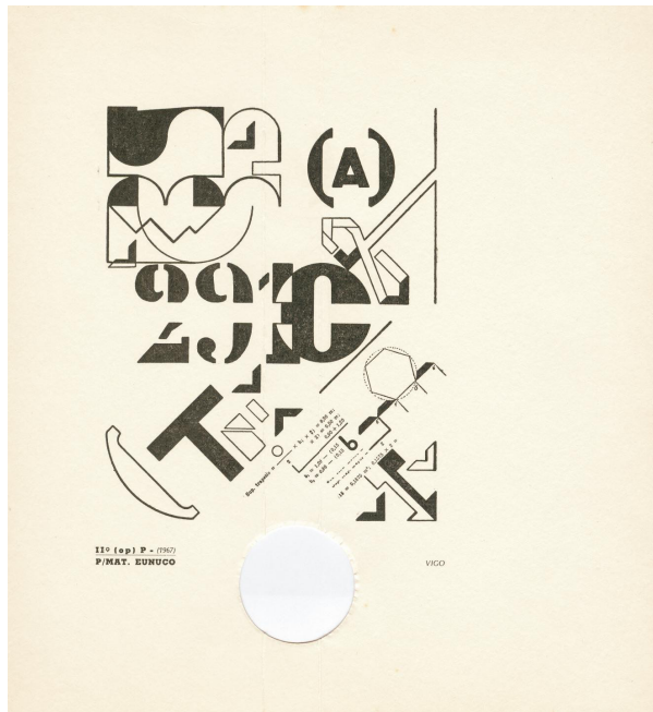
Figura 1. E. A. Vigo, P/Mat. Eunuco, 1967.