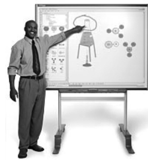
Pizarrón interactivo (IWB)

deber, o bien para debatir el uso de la L2 en situaciones auténticas tomando a los videoclips como modelos.