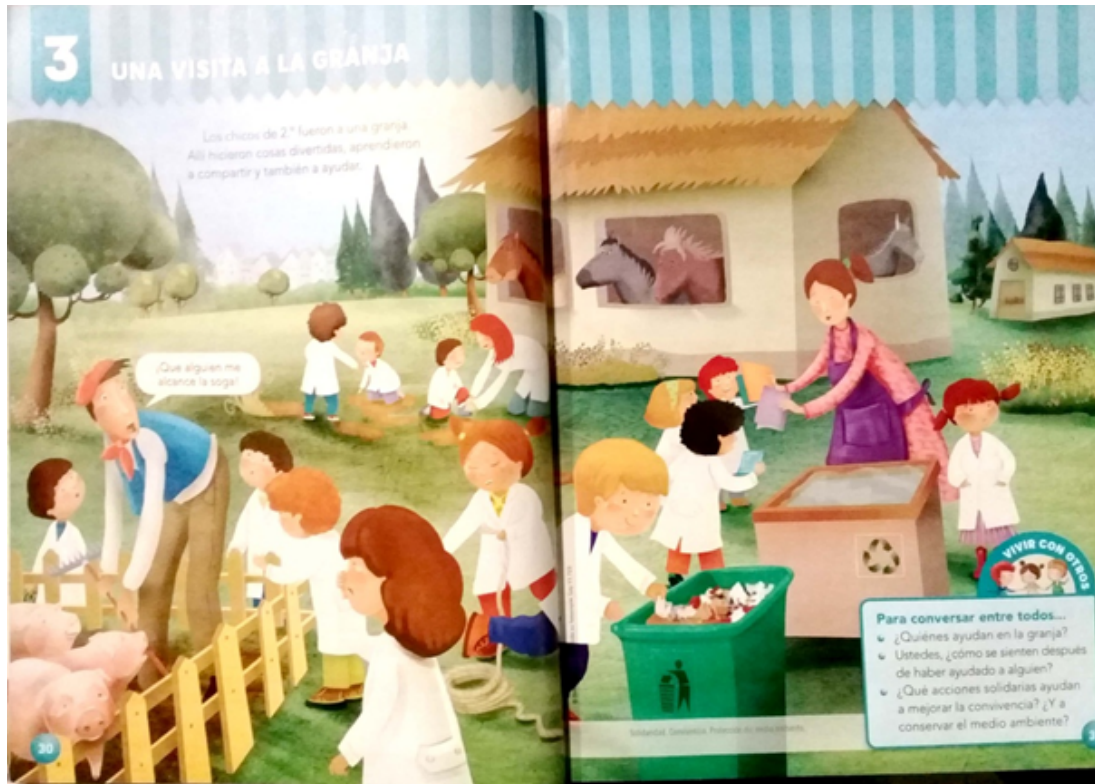
FIGURA 6 Giralunas 2