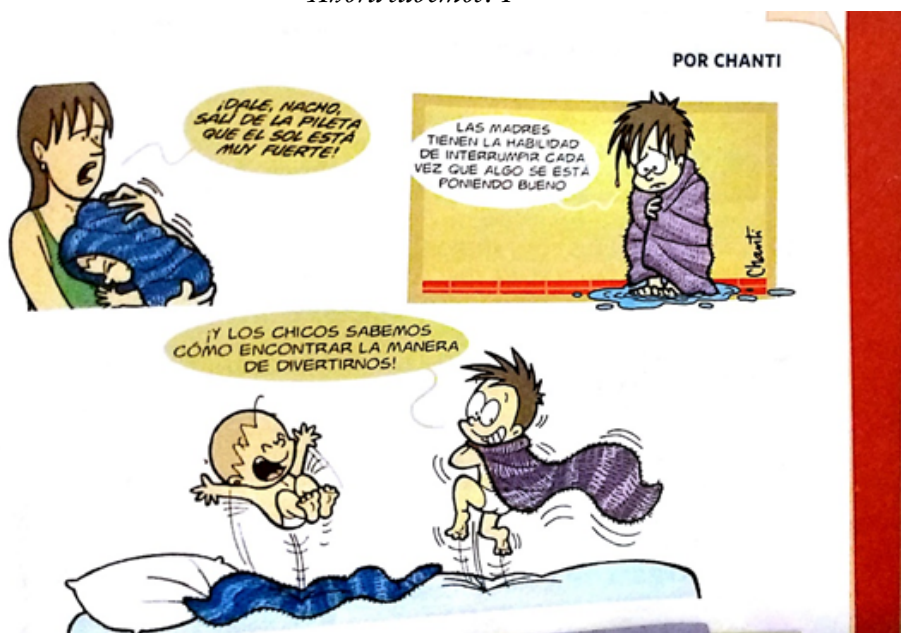
FIGURA 3 “Ahora sabemos! 1”

Como se mencionaba, la madre es el único miembro que no varía en las imágenes; está siempre presente. Esto pareciera responder a un estereotipo de género que, por un lado, asocia la femineidad a la maternidad entendiendo a esta última como una característica inherente del “ser” mujer, y, por el otro, refuerza la importancia de la figura de la madre en la familia debido a su supuesto “vínculo indisoluble” con sus hijos/as, imposible de ser reemplazada por una figura paterna (Nari, 2004). La ideología respecto a la maternidad puede observarse en otras imágenes a lo largo del manual: