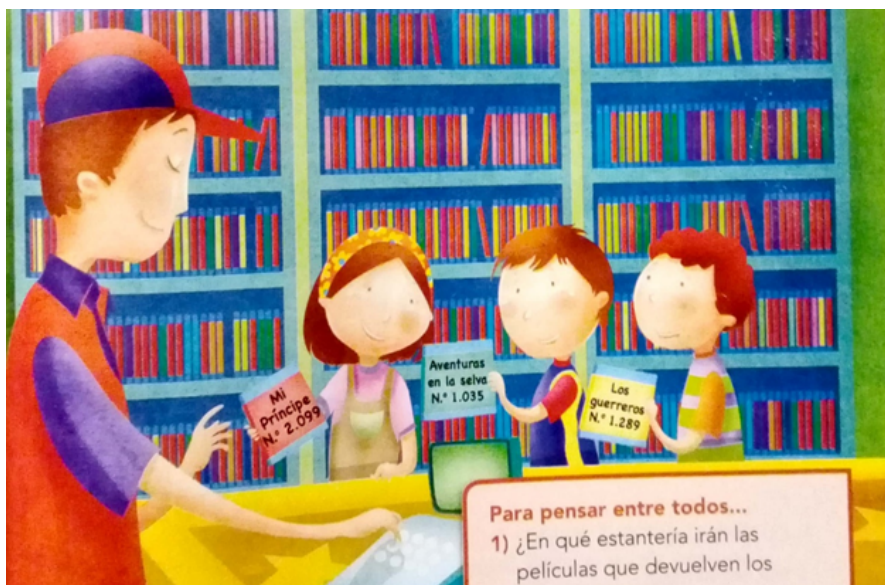
FIGURA 1 Giralunas 2