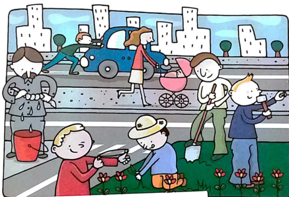
FIGURA 5 ¡Ahora sabemos! 1

Esto también sucede cuando se trata de imágenes que aparecen de manera constante, como “paisaje”, en el resto de las páginas de los manuales, donde si bien la temática central no es el trabajo, pueden observarse personas realizando tareas que reflejan una clara distinción de acuerdo al género. Por ejemplo: