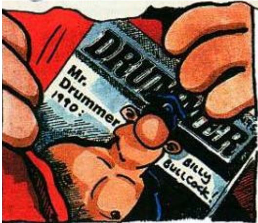
Imagen 5: (König, detalle de viñeta, 1990, p. 74)