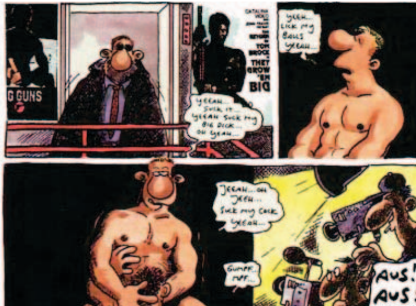
Imagen 3: (König, detalle de viñetas, 1990, p. 44)

En la historieta se entremezclan referencias reales a la pornografía gay de los años ochenta con creaciones ficticiales. Billy Bulcock, que es configurado como un performer del porno gay hardcore (y leather ) actúo con Dick Fisk, un performer real del porno gay. También en el espacio de filmación donde trabaja Billy se incluyen montajes con afiches de películas pornográficas gay reales They Grow 'Em Big (1988, dir. John Travis) y Big Guns (1987, dir. William Higgins):