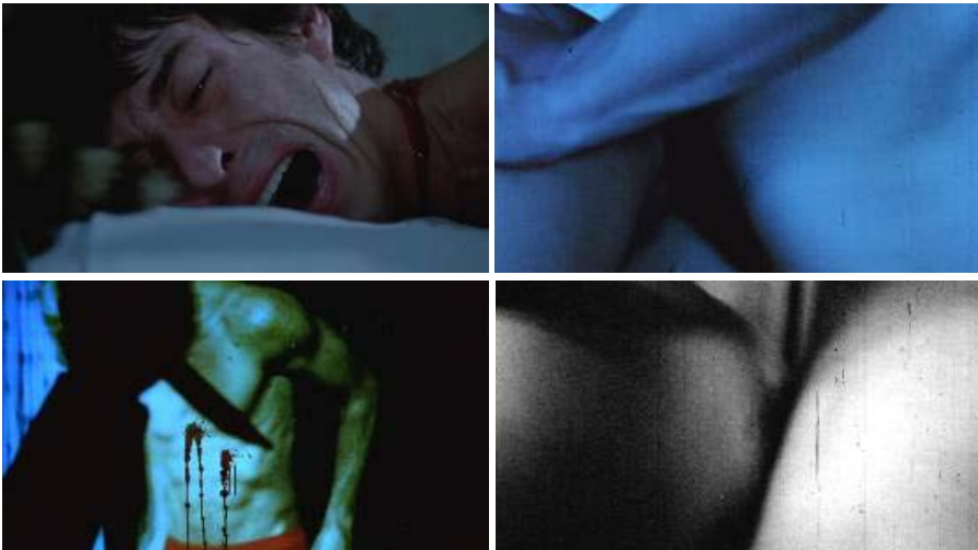
Imagen 4: Cruising (1980, dir. William Friedkin), fotogramas de los asesinatos e imagen porno intercalada, prácticamente imperceptible en la proyección del film

sobre la escena leather de New York se refiere, sin mencionar específicamente el título, a la película Cruising (1980, dir. William Friedkin), realizando un breve Resumen de la misma y marcando claramente la situación del policía heterosexual que por rechazar su posible homosexualidad se convierte en asesino 5 . En el film el ambiente gay leather se presenta como extremadamente patologizado, con el SM gay visto como una práctica “enferma”. La representación sexual sigue con la línea patológica, se elide el momento explícito de acoplamiento sexual, se pasa de la insinuación del sexo oral a los cuerpos desnudos después de la práctica sexual. El uso cultural del SM gay que realiza puede leerse claramente como homofóbico. Entre los varios argumentos que existen para esta lectura, me interesa señalar el uso que hace el film de la imagen de la pornografía gay para fines que considero homofóbicos. En el film, luego del contacto sexual, un psicópata (gay, por supuesto) asesina a otros personajes gays. Lo que llama la atención es que en el instante de cada uno de los asesinatos, la “penetración” del cuchillo del asesino es interrumpida durante microsegundos por fotogramas de pornografía gay que visibiliza el momento de la penetración anal, que son sólo apreciables en cámara lenta o en un estudio muy minucioso: