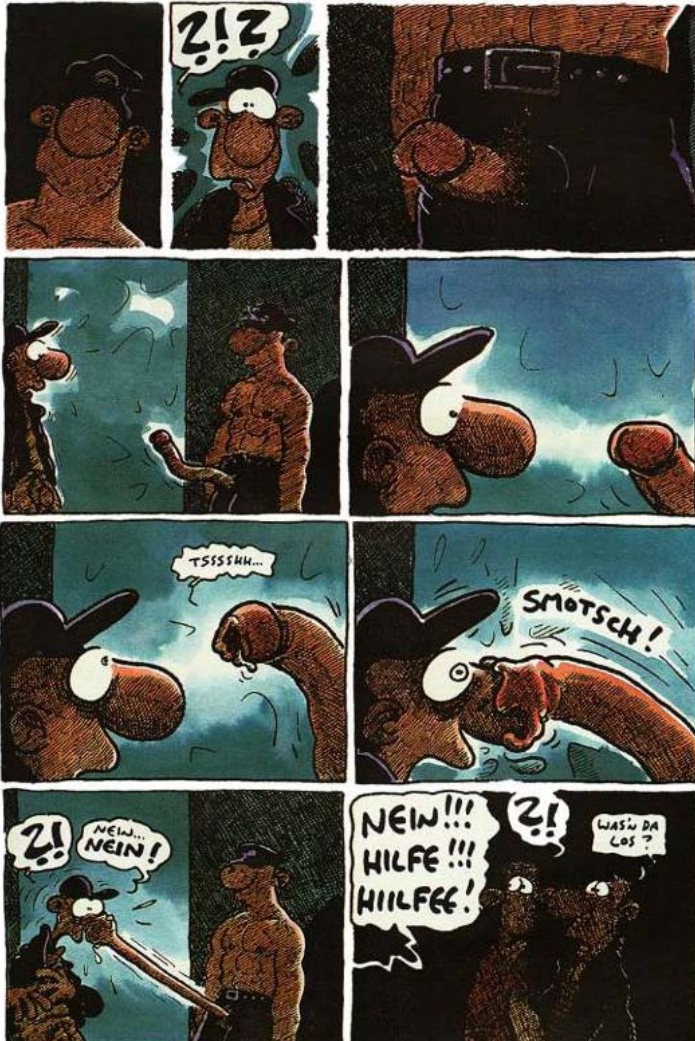
Imagen 2: (König, página completa, 1990, p. 63)

A diferencia de la primera parte, el monstruo ya no será sólo el Kon-dom sino una construcción más compleja: