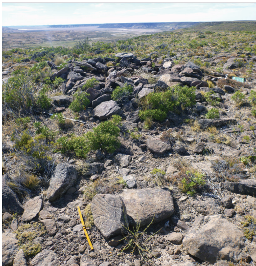
Figura 2. Bloque grabado “a” y estructura anular (EID_1078) del sitio CH005. Al fondo puede apreciarse el bajo de la Laguna Grande