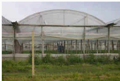
Figura 3: Invernáculos cubiertos con uso de alta tecnología

Tal como señalan Borja y Castells (2000), en la última década, los contrastes sociales en la ciudad se profundizan, y se manifiestan en el territorio "...lo global se localiza de forma socialmente segmentada y espacialmente segregada