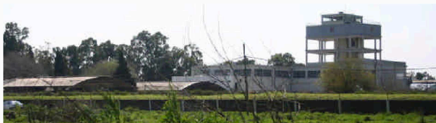
Figura 2: Frigorífico Gorina junto a actividades primario-intensivas

Cuando los componentes de la estructura es-