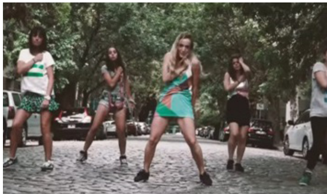
Grito fuerte, Combinado Argentino de Danza, 2017.