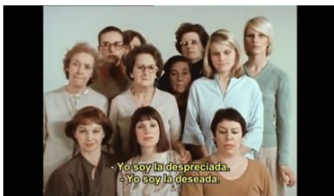
Réponse des femmes: notre corps, notre sex , Agnès Varda, 1975.

que actualiza una memoria discursiva específicamente cinematográfica, que podemos remontar a la emblemática película feminista de Agnès Varda, Réponse des femmes: notre corps, notre sex (1975), que también concluye con una imagen grupal tras documentar un conjunto de testimonios de mujeres que reflexionan sobre las particularidades de su diferencia sexual :