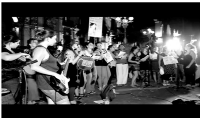
#8M: Colores, fuerza y lucha de una jornada histórica de mujeres, Agencia de Prensa Alternativa, 2017.

La Agencia de Prensa Alternativa 18 realizó un audiovisual que toma la forma de videoclip. Este consiste en una canción, grabada en vivo, que combina estilos de murga, de candombe y de reggae, cantada mayormente al unísono por mujeres en un registro de voz de contralto (se podría decir que a muchas de ellas la melodía “les queda demasiado grave”, como especialmente se nota en los pocos pasajes en los que se busca incorporar una segunda voz), con acompañamiento de charango, guitarra, bajo, percusión y algunos coros: “Hay en la noche un grito y se escucha lejano (...) es la voz del silencio. En este armario hay un gato encerrado porque una mujer defendió sus derechos”.