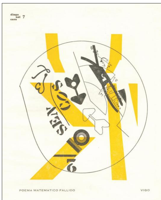
■ Fig. 3. Edgardo Antonio Vigo. Poema matemático fallido , 1966. Archivo del Centro de Arte Experimental Vigo.