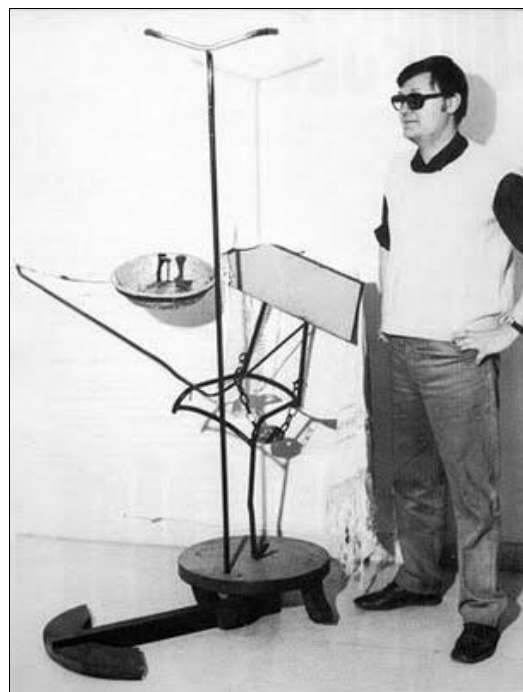
■ Fig. 4. Edgardo Antonio Vigo. Palanganómetro mecedor (que no se mece) para críticos de arte , 1964. Archivo del Centro de Arte Experimental Vigo.