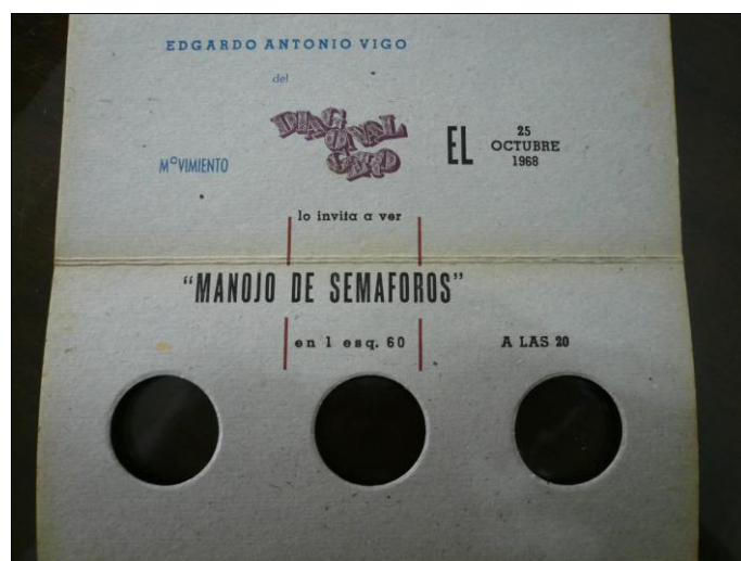
■ Fig. 5. Edgardo Antonio Vigo. Invitación para ver Manoj de Semáforos , 1968. Archivo del Centro de Arte Experimental Vigo.