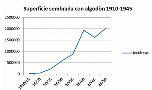
Gráfico 1 – Superficie: Hectáreas con Algodón – Campañas 1909/10 a 1948/49