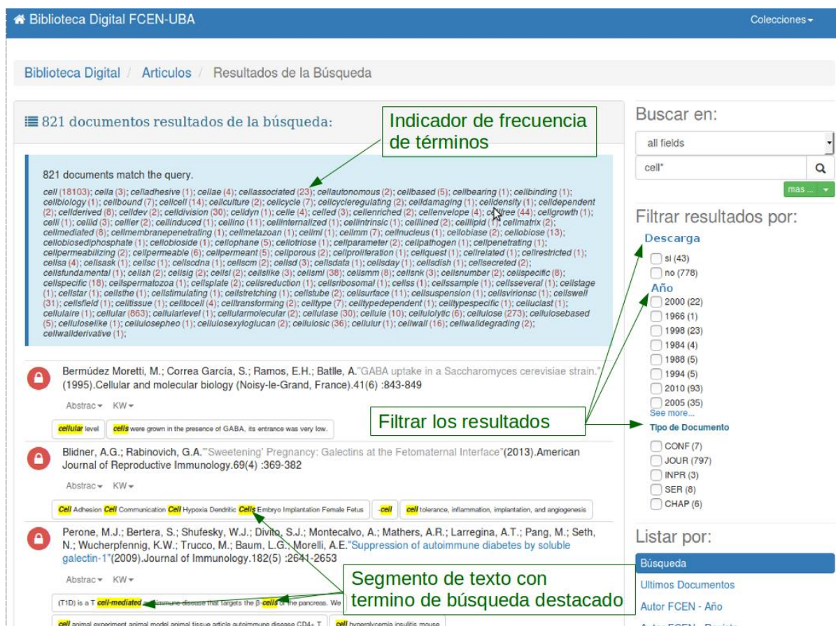
Figura 6. Vista de la pantalla de resultados de búsqueda en la Biblioteca Digital de FCEN-UBA Fuente: Recuperado de http://digital-beta.bl.fcen.uba.ar/ el 28-4-2017.