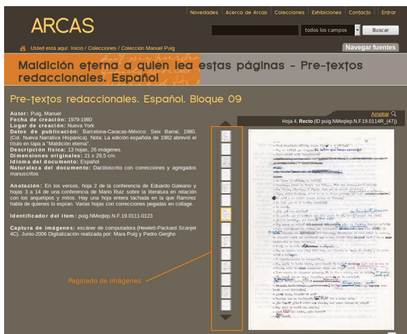
Figura 4. Paginado de imágenes en ARCAS

La colección de los manuscritos de Manuel Puig, en particular, reúne imágenes digitalizadas que han sido organizadas y descritas por el equipo de investigación a cargo. En este caso, se utilizó la implementación de la visualización asincrónica de las imágenes que componen cada manuscrito, desarrollo incluido en Greenstone3 para la representación de imágenes paginadas.