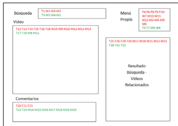
Fig. 3: Prototipo del framework propuesto para el diseño de la interacción en RSV.

En la Fig. 3 se presenta una versión prototipo del framework, con los elementos de interacción obligatoria (rojo) y opcional (verde), y las funcionalidades definidas.