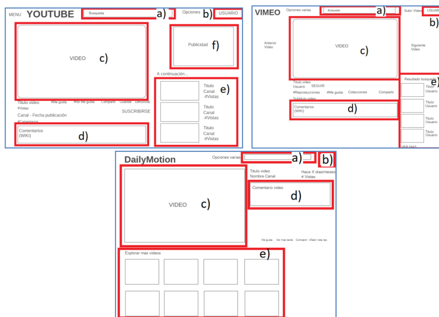
Fig. 1: Wireframes de los portales YouTube, Vimeo, y Dailymotion.

La reproducción de la organización de espacios y elementos obtenidos mediante wireframes (Fig. 1), resultantes de la pantalla “Resultado de la búsqueda” de las RSV analizadas, se lograron encontrar cinco espacios comunes.