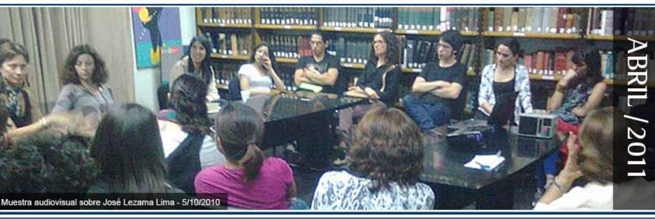
Muestra audiovisual sobre José Lezama Lima - 5/10/2010