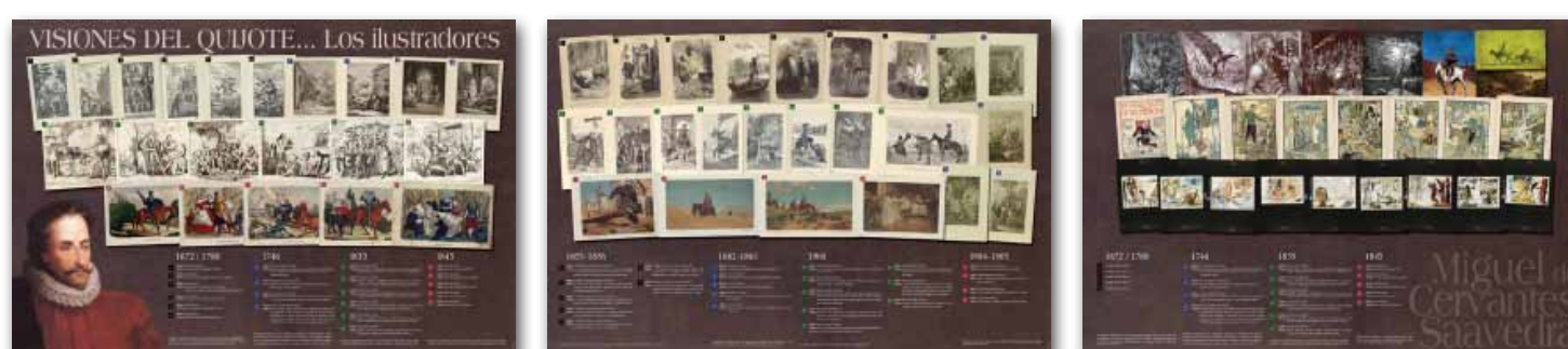
* Afiches de la exposición, estos se encuentran en el pasillo de entrada de BIBHUMA.