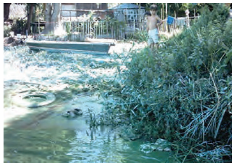
Fig. 1. La foto grafica un evento de exposición directa de personas a un intenso florecimiento de Microcystis aeruginosa en la Isla Santiago en la entrada del puerto La Plata en la margen sur del Río de La Plata.

El segundo objetivo es la evaluación y el manejo de riesgo . Para la evaluación del riesgo es necesario establecer las vías y la intensidad de la exposición. Esto requiere la integración de datos de calidad del medio ambiente con una estimación de la tasa de contacto humano con los medios contaminados. Este aspecto de la evaluación del riesgo debe basarse en datos locales, ya que permite una evaluación de las condiciones particulares y las prácticas culturales locales que afectan el potencial de riesgo. Los datos locales sobre los patrones de consumo de alimentos, los patrones de actividad al aire libre, los tipos de vivienda, la prevalencia de condiciones de salud, etc. pueden ser importantes para el proceso de evaluación. Estos datos se pueden obtener del departamento de salud local y los ministerios de servicios sociales, los ministerios o secretarías del medio ambiente (responsables primarios del monitoreo imprescindible del fenómeno cianobacteriano), organizaciones no gubernamentales, o de investigaciones sociológicas realizadas como parte del análisis.