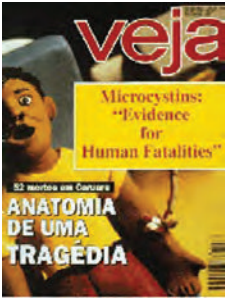
Fig. 2. Expresión en una revista de temas generales de la tragedia de Caruarú.

En nuestro país la toxina más estudiada es la Microcystina, sin embargo, no necesariamente implica que sea monitoreada regularmente en los principales cuerpos de agua. De las otras toxinas conocidas anatoxina, cylindrospermopsina y saxitoxinas sólo existen registros puntuales. Pocos laboratorios en el país tienen capacidad técnica y la infraestructura necesaria para la detección y cuantificación de alguna de las toxinas mencionadas.