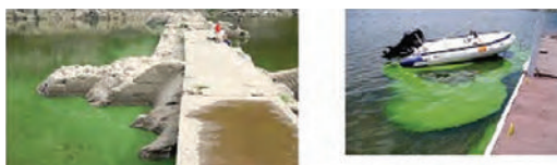
Fig. 3: Floración de cianobacterias en el Embalse San Roque. Fuente de agua para la ciudad de Córdoba- Argentina.

Los cambios en la coloración constituyen un indicador de la presencia de algas, así como lo son la formación de espumas, natas, presencia de animales muertos y detección de olores extraños.