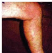
Fig. 3. Foto tomada de Gary Winston, 2010, donde se observan alteraciones cutáneas luego de una exposición a cianobacterias (18).

La Figura 3 muestra inflamación cutánea con eritema ampollado y descamación dentro de las 12 hs. a partir de la exposición a un florecimiento cianobacteriano con presencia mayoritaria de Lyngbia sp. Es una de las más comunes afecciones que sufren cientos de personas todos los años al bañarse en aguas con florecimientos y que refieren picazón y enrojecimiento de la piel más evidente en las zonas donde ajusta la ropa. Este tipo de afecciones se atribuyen a los lipopolisacáridos (LPS) de la pared celular de las células de las cianobacterias, fundamentalmente al Lípido A, sin embargo hasta ahora no hay en la literatura científica suficientes datos como para sustentar esta idea tan ampliamente distribuida (18).