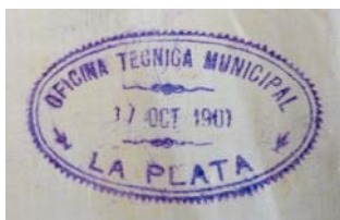
17 de octubre de 1901. Sello Oficina Técnica Municipal.

La Oficina de Delineaciones operó en el ámbito provincial y local hasta la instalación de la Municipalidad 6 que, de acuerdo con la ley orgánica de 1890 y al amparo de la Constitución de 1889, permitió la elección del primer Intendente y la definición de la estructura institucional que manejaría los asuntos públicos de la comunidad platense. Esa ley le reconocía a los municipios de la provincia, entre otras facultades, las de aprobar proyectos y controlar las construcciones de obras privadas ajustadas a las normas y reglamentos que, por ordenanzas o resoluciones, el mismo municipio definía e implementaba. En el organigrama del primer municipio platense aparece entonces la Oficina Técnica Municipal que comprendía tres secciones: proyectos, obras y conservación; niveles, delineaciones e inspecciones y alumbrado público y maquinarias; una oficina de contraste de pesas y medidas y un archivo a cargo de un “oficial 1º archivero”, entendemos responsable del primer registro local de expedientillos de obras privadas de la ciudad.