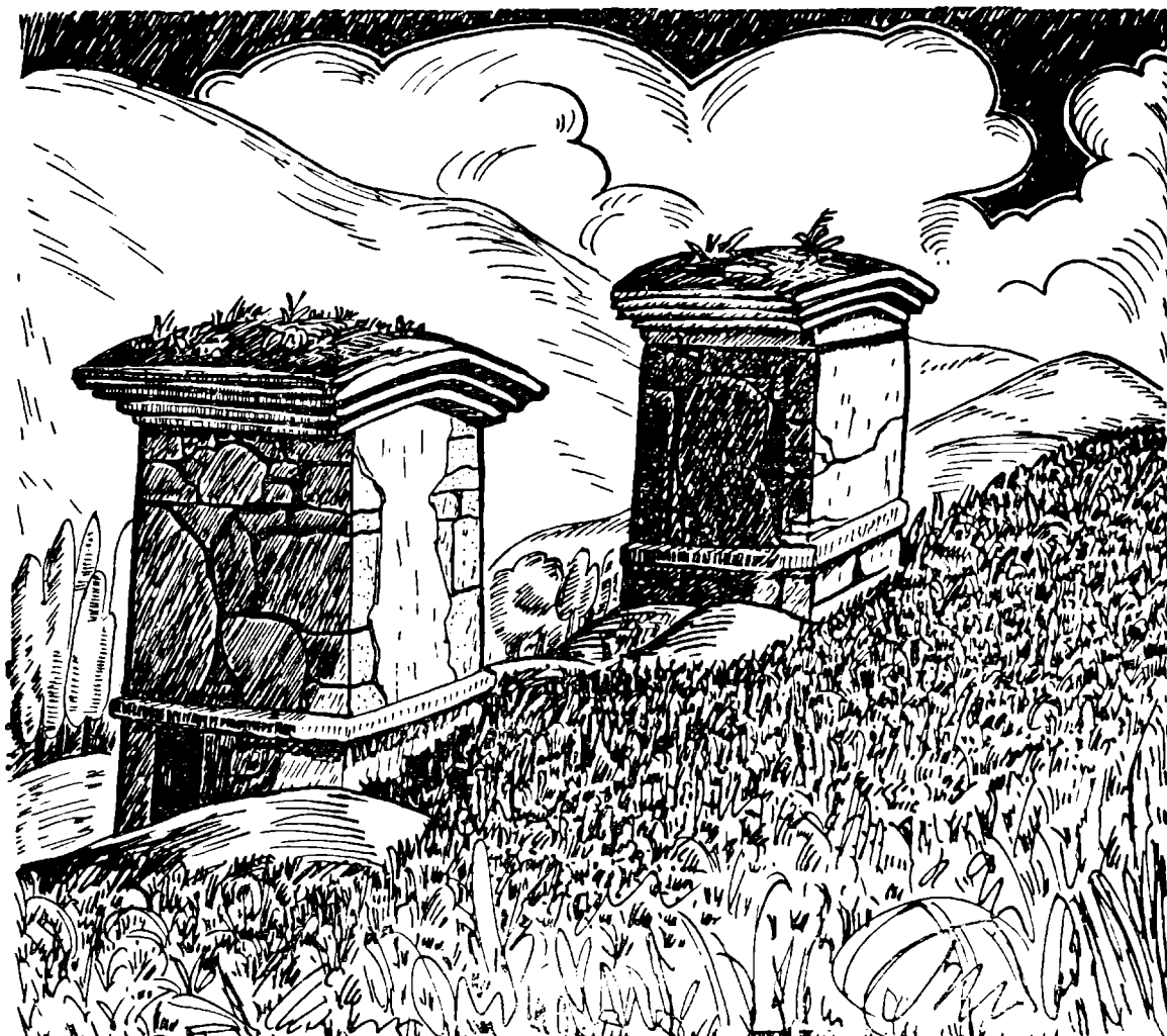
Fig. 1. Chullpas de Chokta, Celendín, Cajamarca

bajo de grandes peñascos para librarse de la lluvia, como en la Hoya del Utcubamba; y en la cumbre de los contrafuertes y picachos de la sierra, como en Chokta, provincia de Celendín. Son exponentes de este tipo las chullpas de Chokta y Rewash (Fig. 1 y 2).