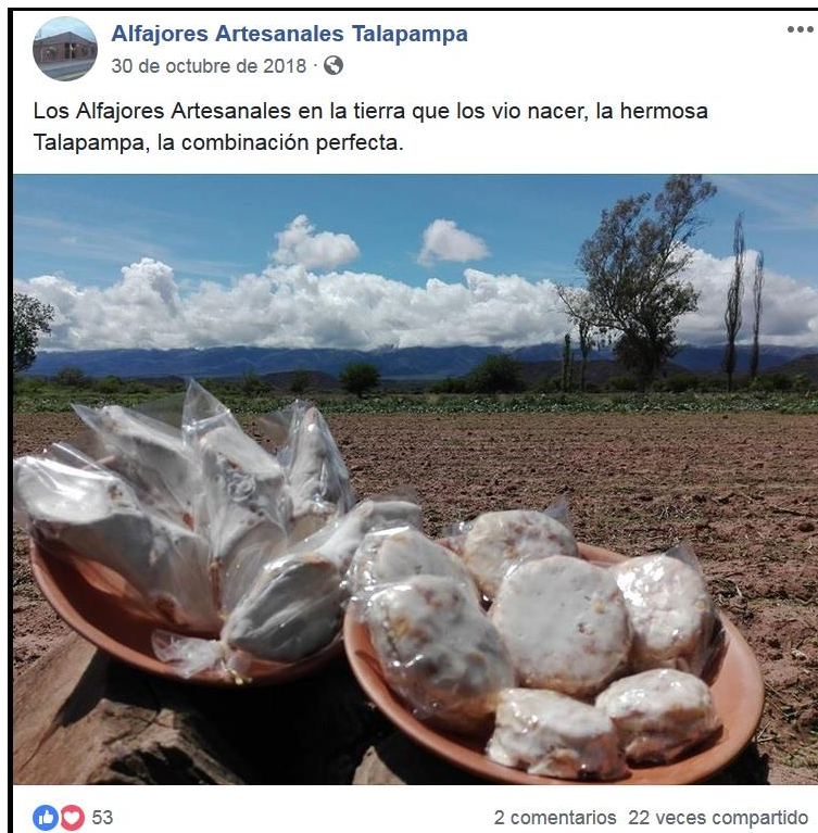
Figura 11. Publicación en Facebook de la marca Alfajores Artesanales Talapampa (Talapampa, Salta).