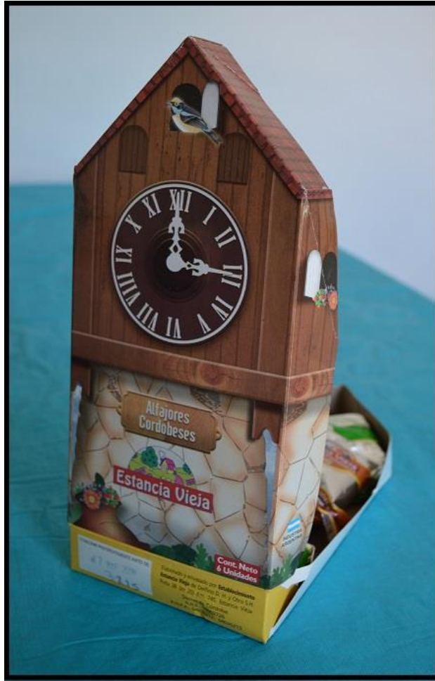
Figura 5. Caja de alfajores cordobeses.