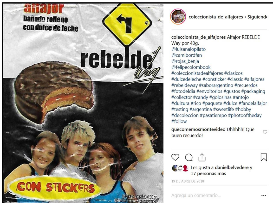
Figura 12. Publicación en Instagram de la cuenta El Coleccionista de Alfajores.

En el último lustro, se desarrolló, con un considerable éxito mediático, la cata de alfajores como ocupación lúdica, no exenta de rigurosidad, partiendo del hecho de que se trata de un producto de fácil acceso. A diferencia de un sommelier que analiza etiquetas exclusivas, estos catadores se refieren a productos masivos sobre la que numerosos internautas tienen experiencia, impresiones, recuerdos. De allí la posibilidad de volcar la propia opinión y generar intercambios sobre gustos y preferencias en el ámbito de los alfajores industriales (que se consiguen en cualquier lugar del país), además de señalar las virtudes de su alfajor regional preferido (que es representativo de su lugar de origen o del lugar que frecuentan en sus vacaciones). Las redes sociales permiten que usuarios que no son productores compartan su gusto por esta golosina a través de sus propias revisiones en Youtube, o exponiendo su colección de envoltorios de alfajores en Instagram (Vice, 22/10/2018) (figura 12).