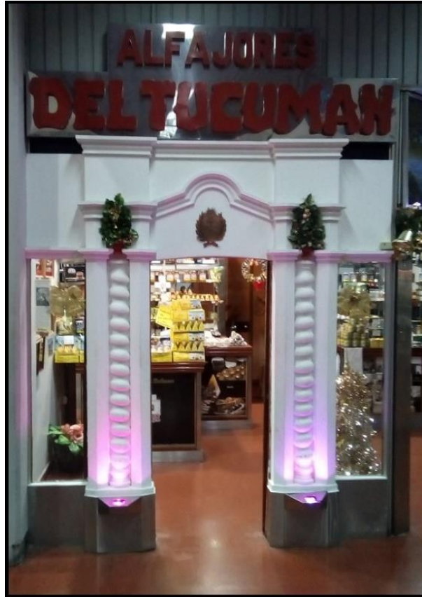
Figura 8. Tienda de la marca Alfajores del Tucumán en el aeropuerto de San Miguel de Tucumán reproduce líneas arquitectónicas de la Casa Histórica.