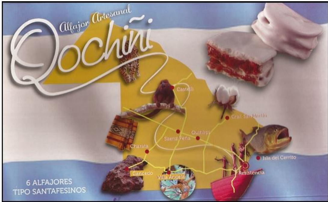
Figura 3. Caja de alfajores de tipo santafesino, producidos en Corrientes, que retrata el mapa de Chaco con sus principales atractivos turísticos.