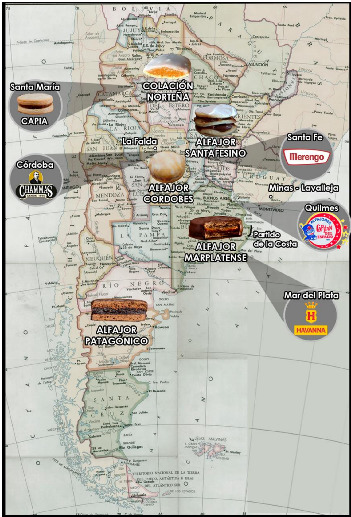
Figura 15. Síntesis de elementos mencionados en el trabajo. Fuente: elaboración propia a partir de cartografía base.