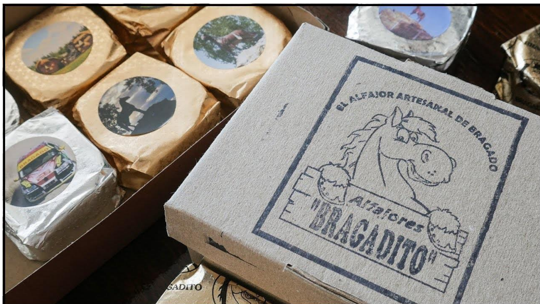
Figura 6. Alfajores de Bragado (Buenos Aires) toman nombre de la leyenda del caballo que da nombre a la ciudad.