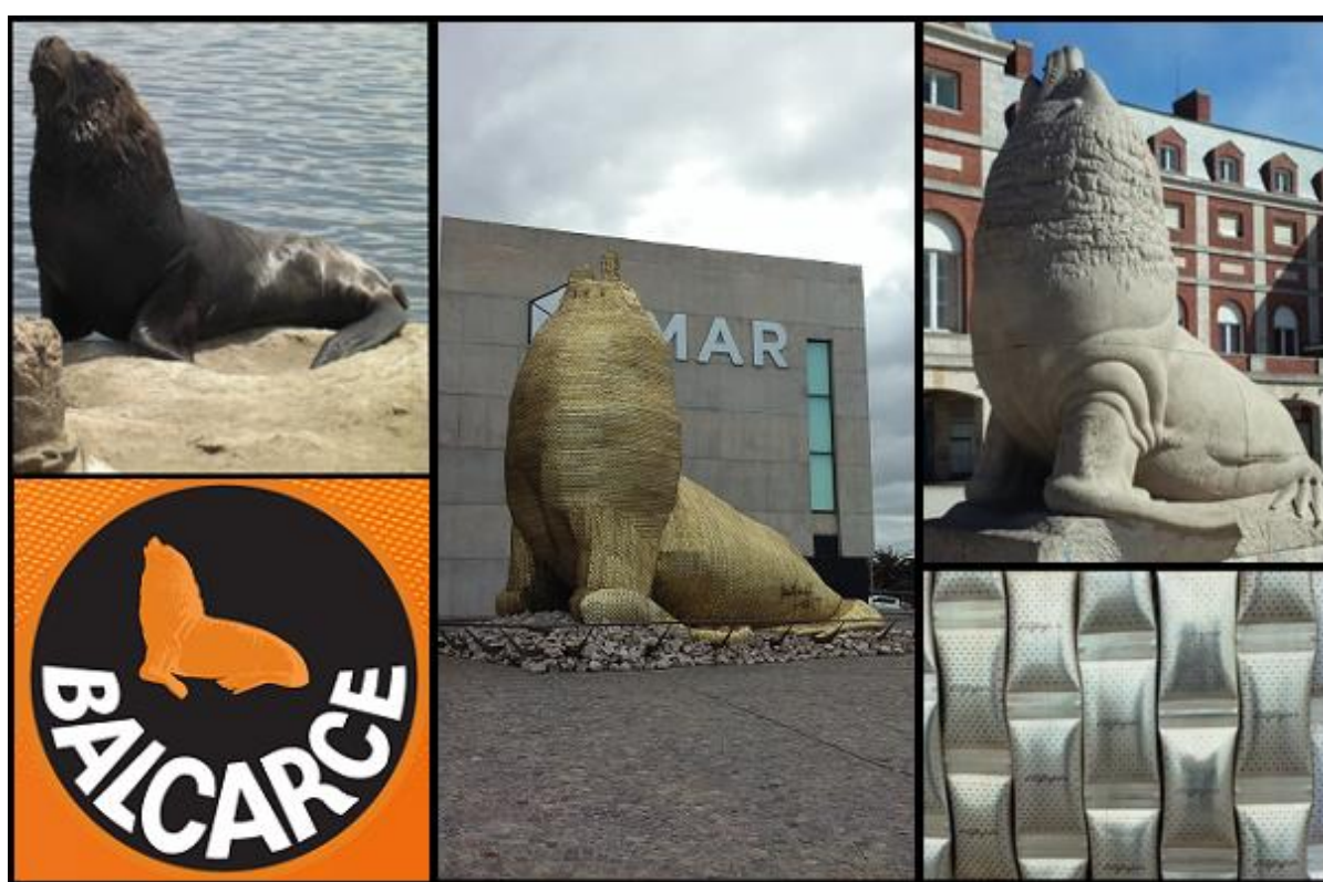
Figura 14. Lobo marino en la escollera marplatense. Logotipo de la marca Balcarce tomado de la página oficial de la marca. Obra “Lobo marino de alfajores”. Estatua de Fioravanti. Detalle del recubrimiento de la obra que simula alfajores Havanna.

revestimiento definitivo, que conserva la idea de una piel de alfajores para el animal. En palabras de la autora, “esto es cultura instantánea, porque se revaloriza el otro lobo, y se revaloriza también el otro invento del alfajor” ( Telef3 Noticias , 13/10/2014). La inauguración fue un motivo para que sectores populares marplatenses se acerquen a una zona específica de la ciudad y al propio museo, que alberga colecciones de arte contemporáneo. Esta obra condensa buena parte de nuestros argumentos, al jerarquizar el alfajor como un ícono cultural asociado al turismo y destinado también a la contemplación y el placer visual (figura 14).