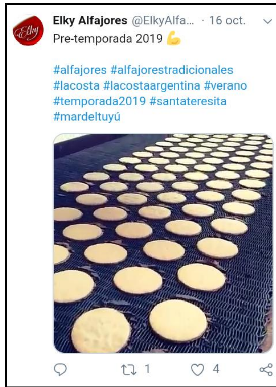
Figura 10. Publicación en Twitter de la marca Elky con animación de la producción (Santa Teresita, Buenos Aires). Fuente: https://twitter.com/ElkyAlfajores/status/1052199418202599424 .