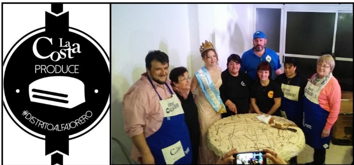
Figura 1. Logo del Distrito del Alfajor Costero tomado de Facebook Distrito Alfajorero De La Costa. Corte del alfajor gigante en la 4ta Fiesta del Alfajor Costero. Fuente: imagen del autor, julio de 2018.

La iniciativa cuenta con el antecedente de la Fiesta Nacional del Alfajor, organizada en la localidad cordobesa de La Falda desde 1989, con intermitencias. El evento, en el cual se elige el mejor alfajor del país en diferentes categorías, cuenta con stands de todo el país, además de números musicales, clases de cocina, y la elección de la Reina Nacional del Alfajor. La República Oriental del Uruguay tiene su propio festejo, con epicentro en la ciudad de Minas (departamento de Lavalleja), cuna del tradicional alfajor Sierras de Minas. Allí se realizó la Primera Fiesta del Alfajor en 2010, ocasión en la que se fabricó el alfajor más grande del mundo, de más de 400 kilos y tres metros de diámetro ( Montevideo Portal , 7/12/2010). En estos casos el alfajor se convierte en un atractivo en sí mismo, alrededor del cual se organizan eventos que diversifican la oferta.