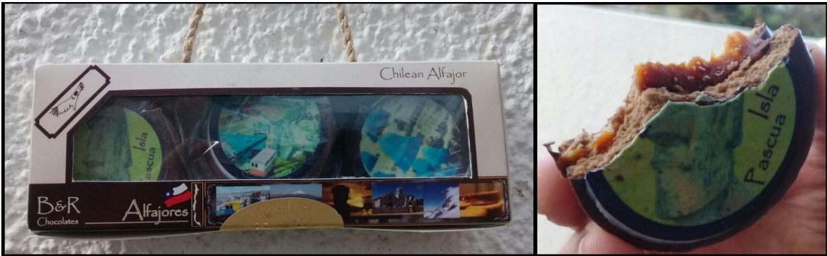
Figura 4. Alfajor chileno con fotos comestibles.