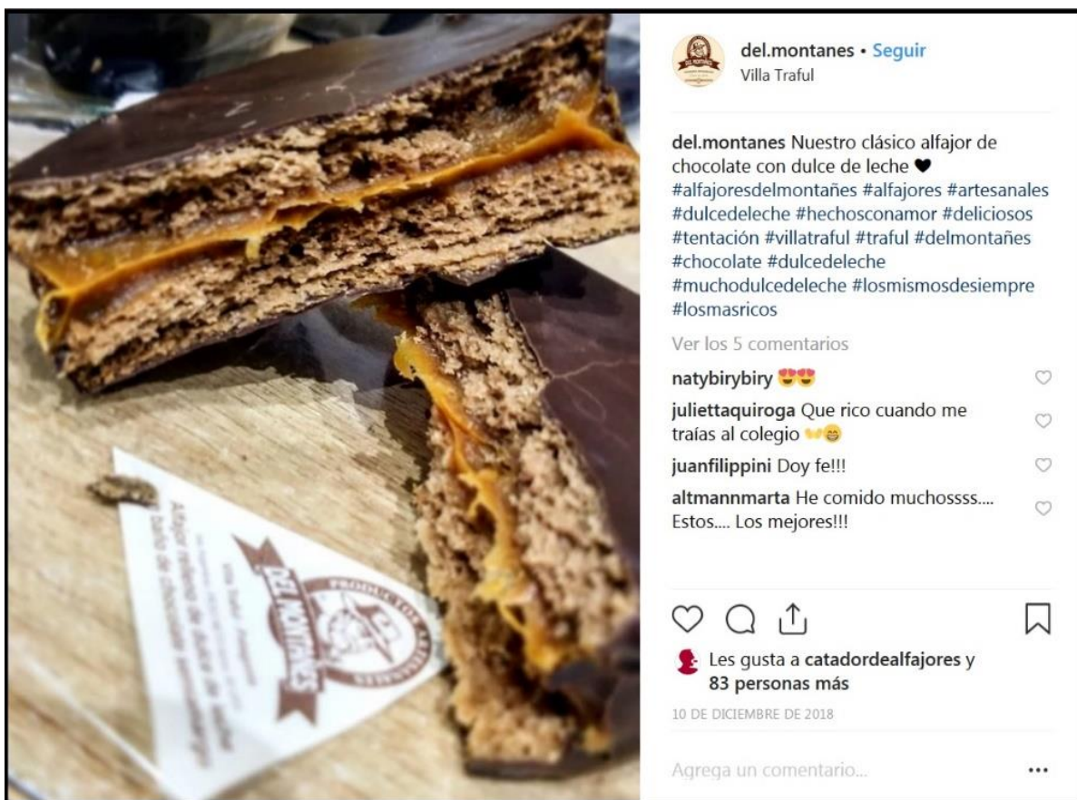
Figura 9. Publicación en Instagram de la marca Productos del Montañés (Villa Traful, Neuquén).

El primer indicador es la constatación de la gran cantidad de emprendimientos, desde aquellos artesanales hasta marcas tradicionales de carácter industrial, que utilizan las redes sociales para promocionarse. Abundan los ejemplos de un uso cuidadoso de la fotografía de los diferentes productos, que recuerdan el famoso proverbio de que la comida entra primero por los ojos (figura 9). Otra estrategia es mostrar diferentes instancias del proceso productivo, para reforzar el carácter artesanal del mismo (figura 10). O bien retratar los productos en escenarios naturales o rurales, que consoliden su ligazón con su terruño (figura 11).