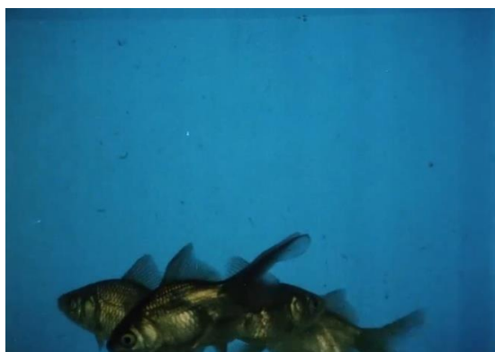
Figura 10. Acha, J. (1986).

Ichtyis : pez, en griego. También, un símbolo con la forma del perfil de un pez, empleado por los cristianos primitivos como seña secreta. El pez es Jesús. Jesús es el desaparecido (Bertazza, 2017). El desplazamiento metafórico estalla en la secuencia siguiente, donde la narración radial del sacerdote es sustituida por música lírica pop. Los peces (y la sangre) proliferan.