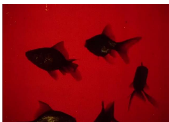
Figura 16. Acha, J. (1986).

Vale decir que los planos en los filmes de Acha son de muy breve duración, ya sea por una búsqueda estética específica o por las limitaciones propias del equipamiento a su disposición (una cámara Bollex a cuerda —habitual en el cine avant-garde del siglo XX— imposibilitada de