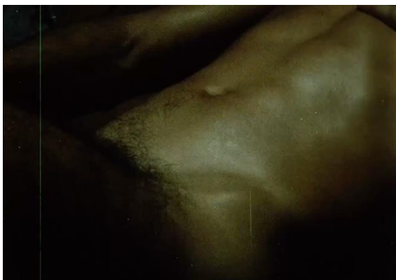
Figura 5. Acha, J. (1986).