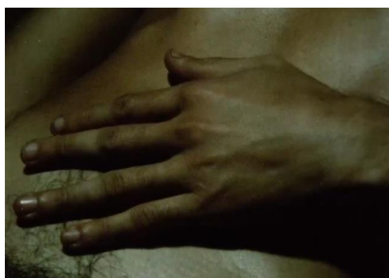
Figura 9. Acha, J. (1986).

El primer fotograma nos muestra el plano del detenido-desaparecido tirado desnudo en su celda. A partir del segundo, el plano se va cerrando, lo que fragmenta el cuerpo. Recordemos lo que decía Benjamin sobre la ruina y el cuerpo despedazado en el barroco. El tercer