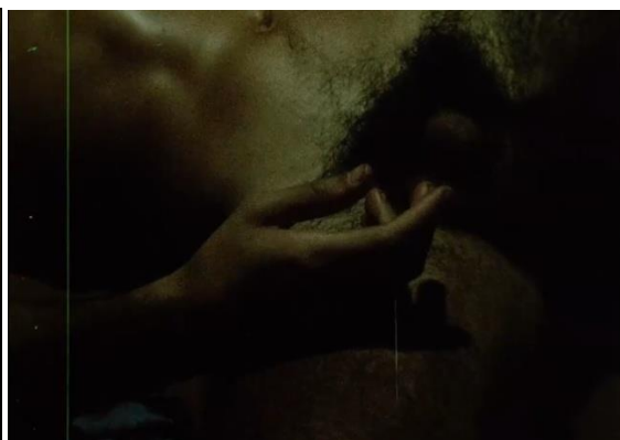
Figura 6. Acha, J. (1986).