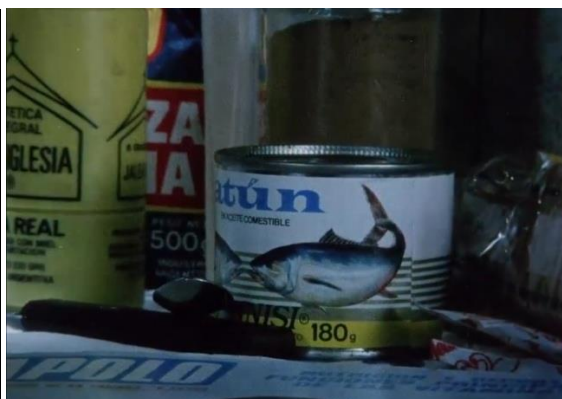
Figura 8. Acha, J. (1986).