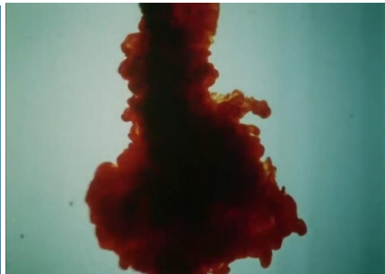
Figura 15. Acha, J. (1986).