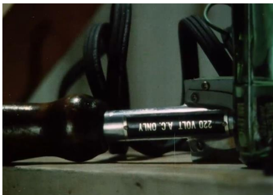
Figura 3. Acha, J. (1986).