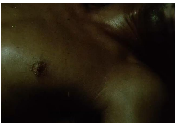
Figura 7. Acha, J. (1986).