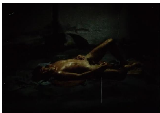
Figura 1. Acha, J. (1986).

En Habeas Corpus (1986), su primer largometraje, rodado en 16 milímetros entre 1983 y 1984, nos cuenta el padecimiento de un detenido-desaparecido en su celda, en los momentos entre las sesiones de tortura, durante la Semana Santa. Intercaladas, escenas del accionar de su carcelero-torturador y de juegos en la playa con otro muchacho. Veamos cómo el montaje trabaja a nivel del interpretante, por desplazamiento de metáforas y repetición. Consideremos estas dos secuencias consecutivas. Ilustraré con fotogramas colocados en orden según aparecen en la película (omito algunos planos del montaje para sintetizar).