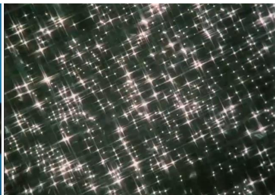
Figura 13. Acha, J. (1986).