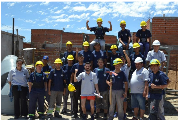
Figura 1. Trabajadores de la cooperativa Los Topos. Barrio Derqui, Caseros.

La cooperativa Los Topos se formó a partir de un grupo de jóvenes con antecedentes penales que comenzó a hacer trabajos de albañilería en el barrio Derqui de Caseros. La formalización de este trabajo en el marco cooperativo les permitió ampliar los trabajos de obra pública a canchas de fútbol, plazas, instalación de cloacas y conexión de agua potable; lo que les permitió aumentar la cantidad de puestos de trabajo. Los testimonios de Araña y Hueso, que citamos a continuación, remarcan que la cooperativa no surgió como una elección entre distintos tipos de asociaciones productivas, sino a partir de una necesidad concreta, encausando una organización de liberados que ya existía previamente. Además, se representa como una decisión entre alternativas acotadas: