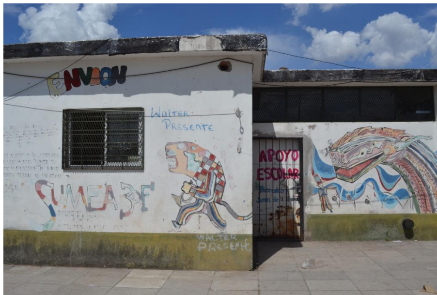
Figura 4. Comedor en el barrio Derqui, Caseros.

de las cooperativas Los Topos, Las Topas y Las Termitas a la Confederación de Trabajadores de la Economía Popular (CTEP).