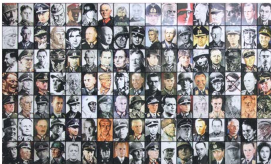
Figura 3. Real Nazis (fragmento) (2017), de Piotr Uklanski. 14 Documenta, Kassel, Alemania

Quiero introducir otra dimensión a partir de la obra Real Nazis de Piotr Uklanski, que pude ver en Documenta 14 en Kassel (2017) [Figura 3]. Se trata de un gran mural rectangular con unos 200 retratos de referentes nazis (desde Adolf Eichmann y Leni Riefensthal, hasta un Hitler marcado, ubicado en el centro) mezclados con fotografías de actores que los encarnaron en la ficción. Una mixtura que remite al horror, pero también a la seducción masiva del cine que les puso otros rostros a esos nombres. Imágenes que nos llevan a interrogarnos: ¿cuántas imágenes de nazis reales construyen nuestra visión del nazismo? ¿Cuánto aportó la cultura de masas a la representación que tenemos de los nazis? ¿Y si ese imaginario fuera solo ficcional? ¿Vale esta pregunta para mucho de lo que hoy es para nosotros una imagen de algo o alguien? La obra es perturbadora e inquietante. Y no solo interroga la relación entre imagen histórica y cinematográfica, sino, también, el espacio más amplio de la relación entre estética y sociedad en el marco de la mediatización de la cultura.