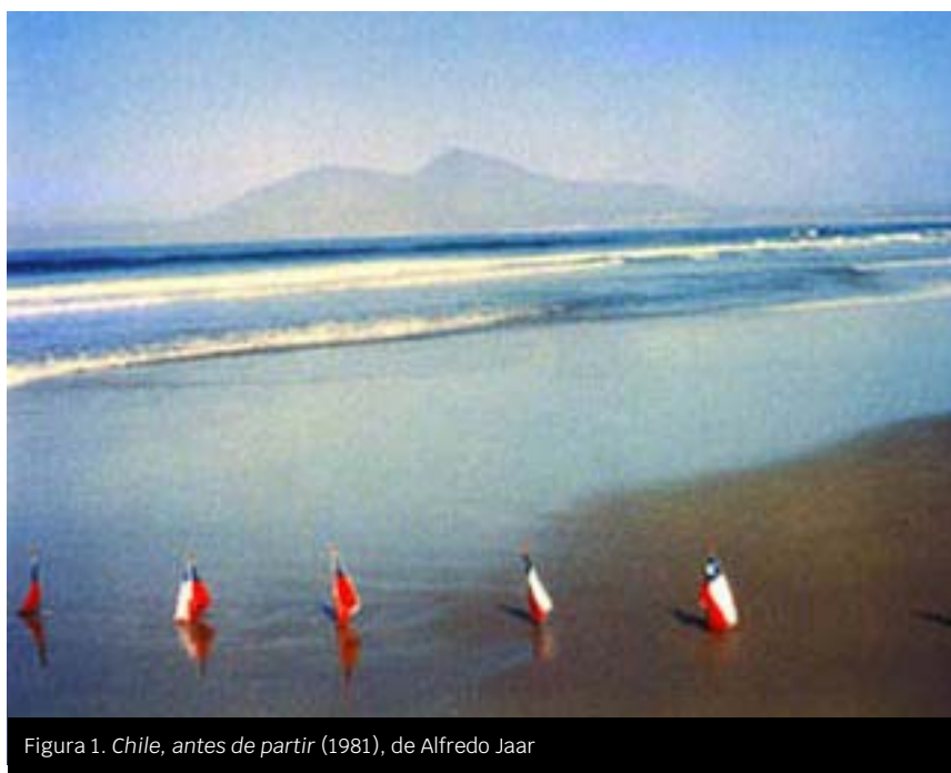
Figura 1. Chile, antes de partir (1981), de Alfredo Jaar

En el año 1981, en un Chile azotado por a la dictadura del general Pinochet, Jaar se despide de su patria realizando una intervención efímera en el espacio exterior titulada Chile, antes de partir [Figura 1]. Dispone una línea de mil banderas chilenas equidistantes que