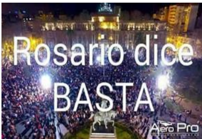
Figura 6: Evento 5 "Rosario dice... BASTA!!!"