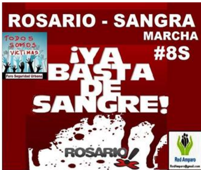
Figura 5: Evento 4 "Marcha 8S Rosario Sangra"