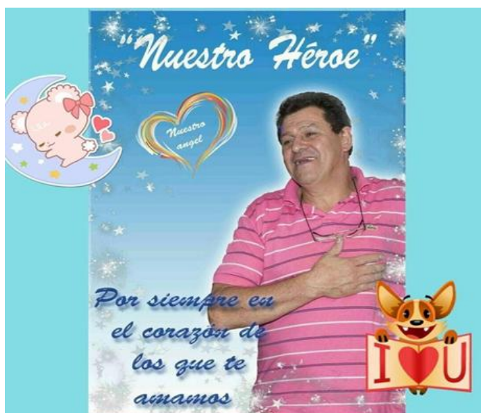
Figura 2: Evento 1 "SOS Rosario Sangra"

Encontramos entonces que no sólo el contenido informativo del evento es relevante y peculiar a nivel del enunciado (del contenido textual publicado), sino también que las operaciones discursivas puestas en juego en el nivel de la enunciación son relevantes para el análisis. Así, tanto el estudio de las imágenes publicadas como la descripción de los eventos analizados nos puede permitir reconocer las imágenes discursivas con las que se define el enunciador, con las que se construye el destinatario de ese enunciado, y con las que se define la relación o el vínculo entre ambos; y también continuar con la indagación sobre el funcionamiento del dispositivo en sí.