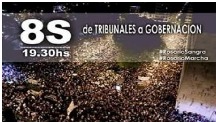
Figura 4: Evento 3 "Rosario Sangra"