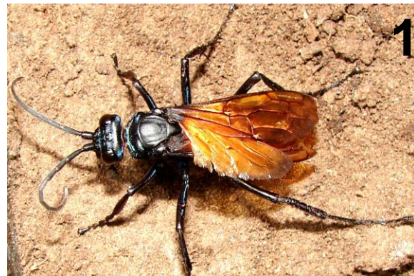
Figura 1. Hembra de Pepsis aciculata in vivo.

una capa de 10 cm. de tierra. En ellos, se construyó una cueva artificial contra el vidrio permitiendo observar el comportamiento de la araña dentro de la cueva. Las experiencias comenzaron el 20-II-2011 y consistieron en la liberación de la hembra de P. aciculata en cada una de los recipientes y observar su comportamiento. Si en 30 min. no se observó ningún ataque, se consideró finalizada la experiencia. Si ocurría el ataque, la observación continuó hasta que la araña fue enterrada. Luego, se procedió a una cuidadosa excavación para retirar la araña inmovilizada y se la colocó en un recipiente artificial con tierra para permitir su observación.