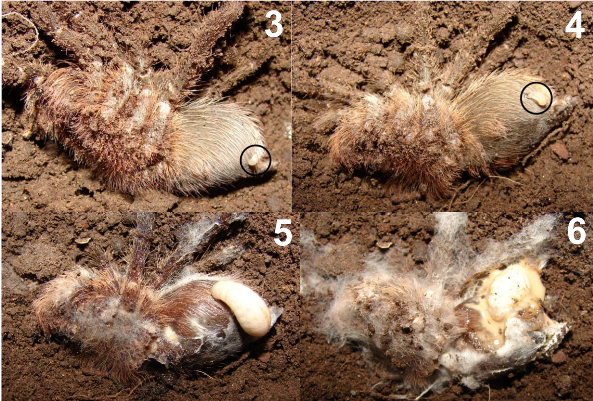
Figuras 3-6. 3. Huevo depositado por la hembra de Pepsis sp. sobre el abdomen de G. vachoni . 4. Larva transcurridos dos días. 5. Larva transcurridos siete días. 6. Larva transcurridos 11 días.