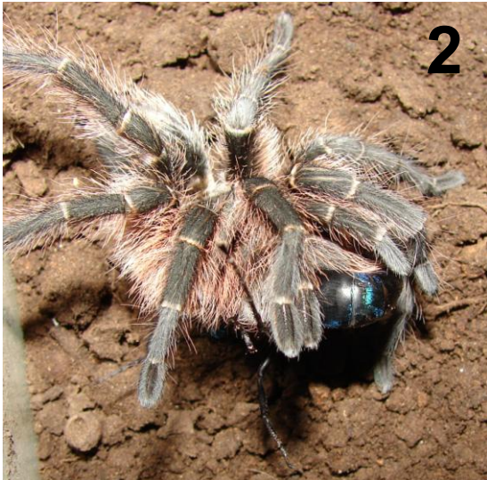
Figura 2. Hembra de Grammostola vachoni depredando sobre la hembra de Pepsis aciculata .

En dos de los cuatro encuentros con las arañas, la avispa entró en la cueva y atacó a la tarántula. En un caso la avispa no solo no atacó, sino que ni siquiera ingresó en la cueva de la araña y en el otro, la araña salió de la cueva y mordió la avispa en su abdomen, causando su muerte (Fig. 2). De los dos casos de ataque, sólo uno resultó exitoso, es decir, la araña quedó totalmente paralizada y en el otro, la avispa ingresó a la cueva, paralizó a la araña, pero al cabo de unos minutos la araña se recuperó y los individuos permanecieron alejados.