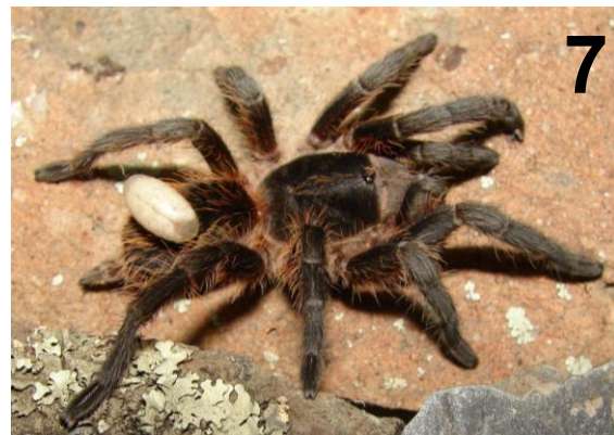
Figura 7. Hembra de Plesiopelma longisternale in vivo con una larva de Notocyphus sp. en el dorso del abdomen.

Después de transcurridos ocho días de su traslado al laboratorio, la larva medía 10,6 mm y ya había consumido casi la totalidad de la araña (Fig. 8). A los 18 días, luego de consumir toda la araña, a excepción de la cutícula, la larva tejó un capullo de color marrón claro de unos 16,4 mm. (Fig. 9) y mudó a pupa, permaneciendo en este estado hasta el inicio de la primavera. Luego de cinco meses, eclosionó una hembra de Notocyphus sp.