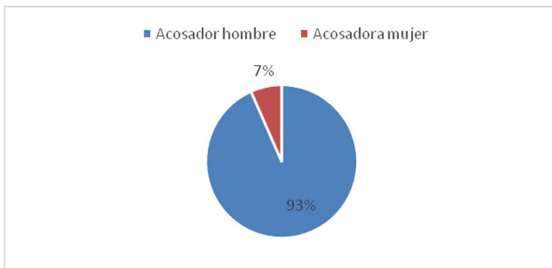
Gráfico N° 3