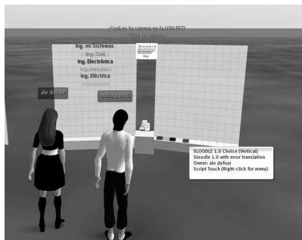
Fig.7.Vista de la Actividad Choice Vertical

La fiabilidad y confiabilidad dependerá de nuestro servidor lo cual es muy importante, sin dejar de lado el bajo costo de concretar un Mundo Virtual con software libre. El uso de estas herramientas libres nos proporciona la posibilidad de crear nuestra propia intranet de Mundos Virtuales UTN a lo largo de nuestro país.