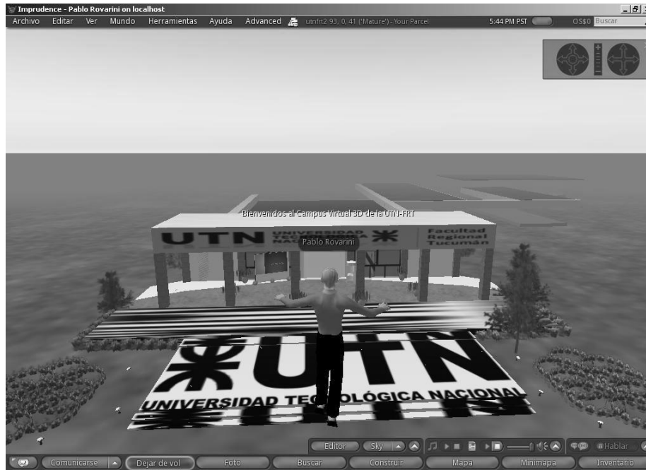
Fig.8. Vista aérea del prototipo UTN FRT