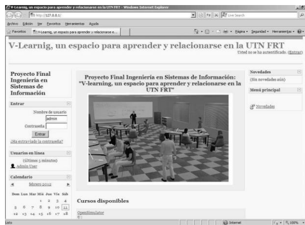
Fig.6. Acceso a Moodle

Aplicación que pertenece al grupo de los Gestores de Contenidos Educativos (LMS, Learning Management Systems), también conocidos como Entornos de Aprendizaje Virtuales (VLE, Virtual Learning Managements), un subgrupo de los Gestores de Contenidos (CMS, Content Management Systems). Una aplicación para crear y gestionar plataformas educativas, es decir, espacios donde un centro educativo, institución o empresa, además gestiona recursos educativos proporcionados por docentes y organiza el acceso a esos recursos para los estudiantes [4].