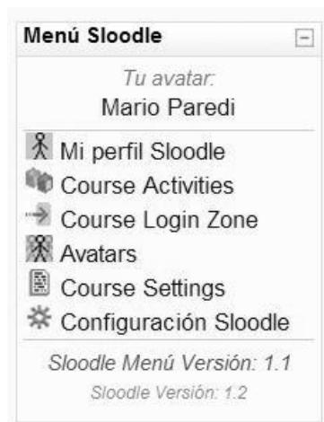
Fig.5. Menu Sloodle en Moodle

Proyecto Open Source (de código abierto) cuyo objetivo es unir las funciones de un sistema de enseñanza basado en web (LMS del inglés Learning Management System o VLE de Virtual Learning Environment) con la riqueza de interacción de un entorno virtual multiusuario 3D (MUVE de inglés Multi User Virtual Environment) [3]. Actualmente todo el desarrollo de Sloodle se basa en la integración entre Moodle y Second Life. De igual manera se puede lograr una combinación de Moodle y OpenSim obteniendo así un desarrollo libre.