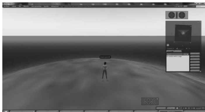
Fig.4. Primera Vista de OpenSim

Simulador 3D libre y de código abierto que utiliza los mismos estándares que Second Life (SL) para comunicarse con sus usuarios. Esto hace posible que los usuarios puedan utilizar el mismo software que provee Linden Labs (empresa que creó Second Life) para conectarse a un servidor controlado por organizaciones o individuos sin relación con esta empresa [2].