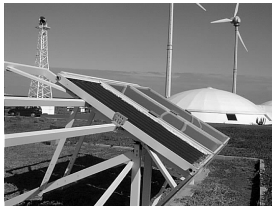
Figura 2: El banco del ITC es de diseño simple, con ajuste de inclinación pero sin posibilidad de modificar acimut