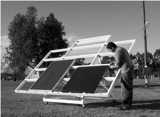
Figura 7: Estructura del banco de ensayos en perfilera de hierro tubo rectangular, UTN-FRBA

moverlos de la estructura, de 3500mm x 2200mm. El plano de soporte, construido en tubos de hierro de 40mm x 80mm x 1,2mm, en la parte superior destina un sector de 1500mm x 500mm para colocar instrumental (figura 7 y 8). La base, también fabricada en tubos de hierro de 40mm x 80mm x 1,2mm, con ruedas de nylon y planchuelas perforadas, permite ajustar la inclinación del plano de apoyo de los colectores a ensayar pivotando sobre un eje, ubicado de tal forma que reparte el peso en forma equilibrada. Los ángulos de inclinación para ensayos cubren el rango de 2°, casi horizontal, a 62°, con intervalos cada 10°.