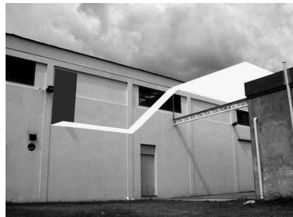
Figura 6: Tecnología metálica y acceso desde el Laboratorio de Ingeniería Civil UTN- FRBA