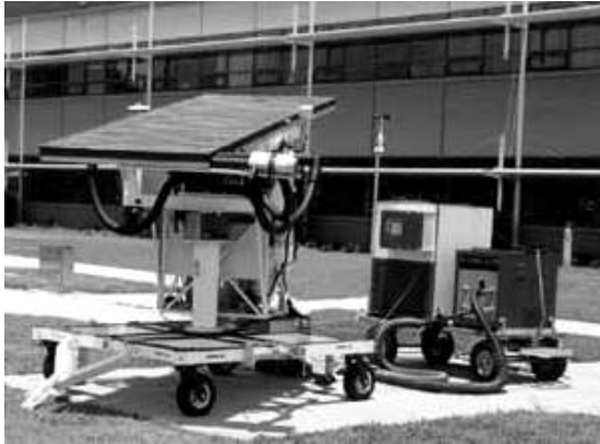
Figura 3: Equipamiento completo del banco de ensayos del Florida Solar Energy Center (FSEC), USA

De equipamiento sencillo pero completo y con posibilidades de ser construido localmente con algunas adaptaciones, el banco de ensayos del ITC cuenta con una sala de instrumentos y equipos anexa, situación que en nuestro caso fue resuelta a través de un elemento móvil que integra todos los accesorios de apoyo a la plataforma necesarios para el correcto funcionamiento del banco. El diseño del móvil o carro que transporta los instrumentos y el cuadro hidráulico hasta el punto de ensayos para su utilización, se basa en el modelo utilizado por el Florida Solar Energy Center (imagen 3 y 4).