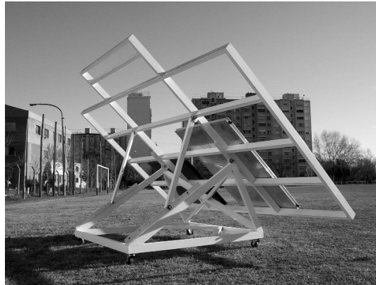
Figura 8: Soporte para colectores pivotante, diseñado para distintas posiciones, UTN-FRBA

Se diseñó y construyó una caldera eléctrica en cobre de 2Kw de potencia de precalentamiento. En ensayos en circuito cerrado, debe preverse la utilización de una resistencia de calentamiento de variación lineal, para suministrar calor al agua de entrada al colector que se está ensayando (figura 9). En el cuadro hidráulico (figura 10), se incluye un enfriador de agua por aire para enfriar el líquido de salida de los captadores.