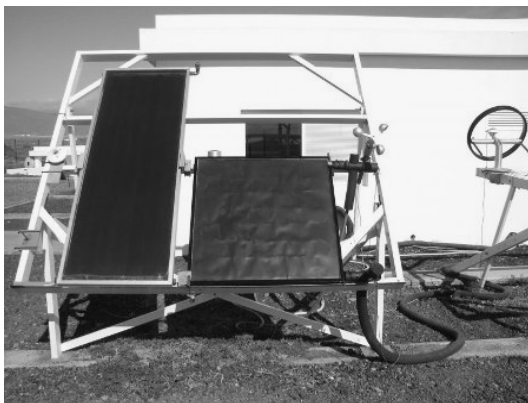
Figura 1: Banco de ensayos del Instituto Tecnológico Canarias (ITC), uno de los más reconocidos en Europa

Se trabajó en la recopilación de información sobre tipos de bancos de ensayo existentes, en operación o no, con el fin de identificar características y diseños que se puedan adaptar a las limitaciones presupuestarias y a las exigencias de las Normas locales. Consultas realizadas a centros de investigación, archivos y datos de bancos de ensayos ubicados en distintas partes del mundo, dieron como resultado valioso material, utilizado para definir el diseño final. El modelo desarrollado, en su parte estructural, tiene como referencia el utilizado en el Instituto Tecnológico Canarias (ITC), construido pocos años atrás (figura 1 y 2).