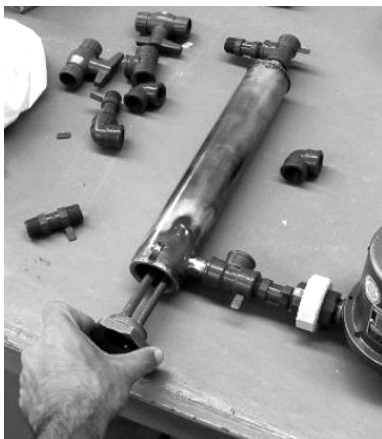
Figura 9: Caldera eléctrica diseñada y construida durante el desarrollo del proyecto, UTN-FRBA