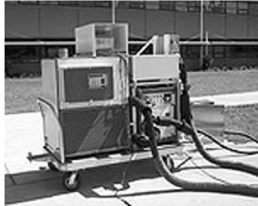
Figura 4: Carro o "movil" de apoyo que contiene el instrumental electrónico y el cuadro hidráulico, FESC