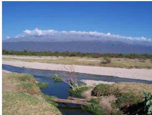
Figura 6. Efluente del sistema de lagunas de estabilización escurriendo por el lecho del río Del Valle.

El reuso del efluente tratado para riego, bajo estrictas medidas de control (OMS, 1989), aportará beneficios económicos y sociales a la zona por la posibilidad de incrementar la superficie bajo riego y los requerimientos de mano de obra. La disposición final del efluente tratado para regar especies vegetales con importancia en el mercado local y nacional redundará en beneficio económico por la factibilidad de incrementar la actividad agrícola. Además la forestación de las zonas aledañas a la planta permitirá la mejora paisajística de áreas muy degradadas por acción eólica y antrópica.