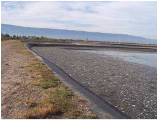
Figura 3. Sólidos flotantes en laguna anaeróbica, Módulo 1.