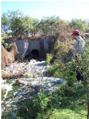
Figura 5. Conducto de descarga del efluente tratado al río Santa Cruz

También se valoró entre las acciones que causan impacto negativo la descarga del efluente tratado al río (Figura 5) -por la vulnerabilidad del acuífero en esta área (Saracho et al, 2007)- y las contingencias por funcionamiento y crecidas. La descarga de una laguna en un cauce seco produce generalmente el mismo efecto que las lagunas anaeróbicas, ya que las algas que se escapan de la batería mueren, con el consiguiente efecto negativo para el ambiente (Figura 6).