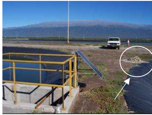
Figura 4. Disposición de sólidos extraídos de la laguna anaeróbica, Módulo 3.

Es necesario destacar que únicamente los usuarios que poseen red colectora pueden acceder al servicio en forma inmediata. El ingreso del resto de la población al sistema está condicionado a la construcción de redes colectoras secundarias. Superada esta situación, la disminución de usuarios de pozos absorbentes impactará positivamente sobre los recursos hídricos, al reducir la contaminación por percolación desde los mismos y los volúmenes de líquidos y lodos contaminantes provenientes del desagote de dichos pozos, que actualmente son dispuestos superficialmente en diferentes sitios. Igual efecto provocará la implementación de un sistema de control de los generadores privados.