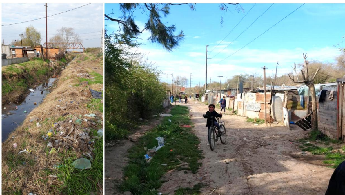
Figura 4: Calle 90 en Puente de Fierro. (Canevari y Bozzano, 2019)

“Nosotros nos poníamos arriba de la mesa y veíamos bichos que pasaban. Por suerte esta vuelta nos habían cortado la luz porque sino te morís electrocutada. Yo estaba preocupada por mi hermano que vive acá en una casilla y no me podía comunicar. También nos queríamos comunicar con mi mamá para ver si de aquel lado (hacia la calle 131) estaban inundados pero los teléfonos no funcionaban.”