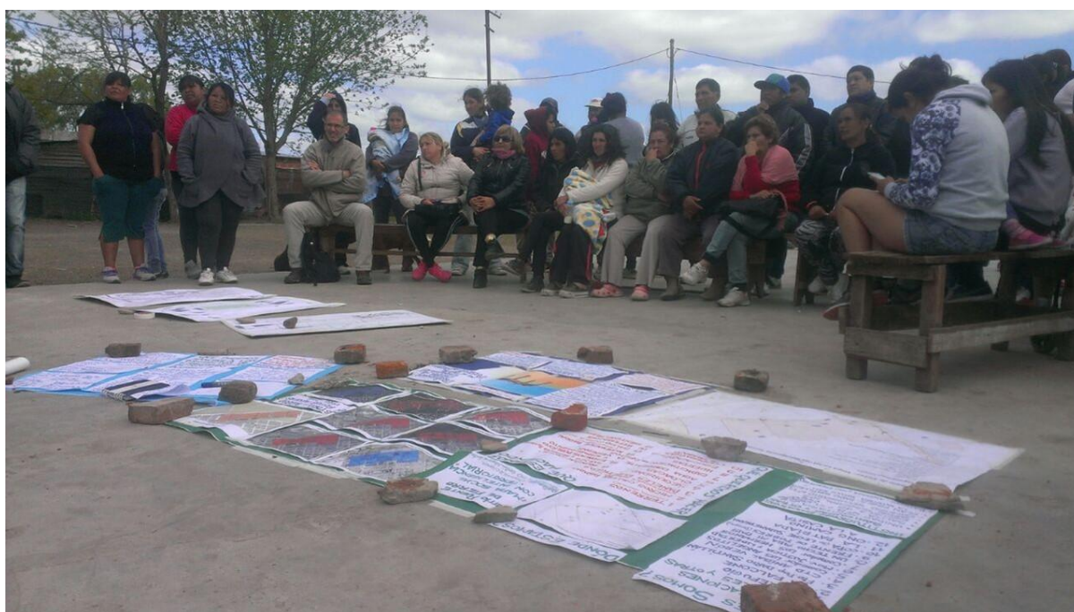
Figura 2: Mesa de Trabajo Permanente en Puente de Fierro (Canevari, 2016).

para el debate y la vehiculización de posibles soluciones a una serie de problemáticas identificadas desde las Ciencias Exactas, Sociales y Naturales, en el marco del Proyecto de Investigación Orientado (PIO) UNLP CONICET “Gestión Integral del Territorio” (2). En uno de los primeros encuentros planificados con vecinos y referentes de organizaciones sociales en Puente de Fierro en agosto de 2016 (Figura 2), una mujer de 60 años referente de una copa de leche expresó con claridad la necesidad de poner en discusión lo naturalizado. Para imaginar un futuro posible colocó en primer lugar la disputa por la construcción simbólica de la ciudad: “Para empezar, el problema es que según el municipio no estamos en el mapa”. Aparece allí una construcción identitaria a partir de una relación de negatividad por parte de un otro, donde se enfrentan dos estructuras significativas que no comparten un sistema común como punto de partida y que se presenta como una oportunidad de generar momentos de des-sedimentación y reactivación de lo social (Fair, 2018).