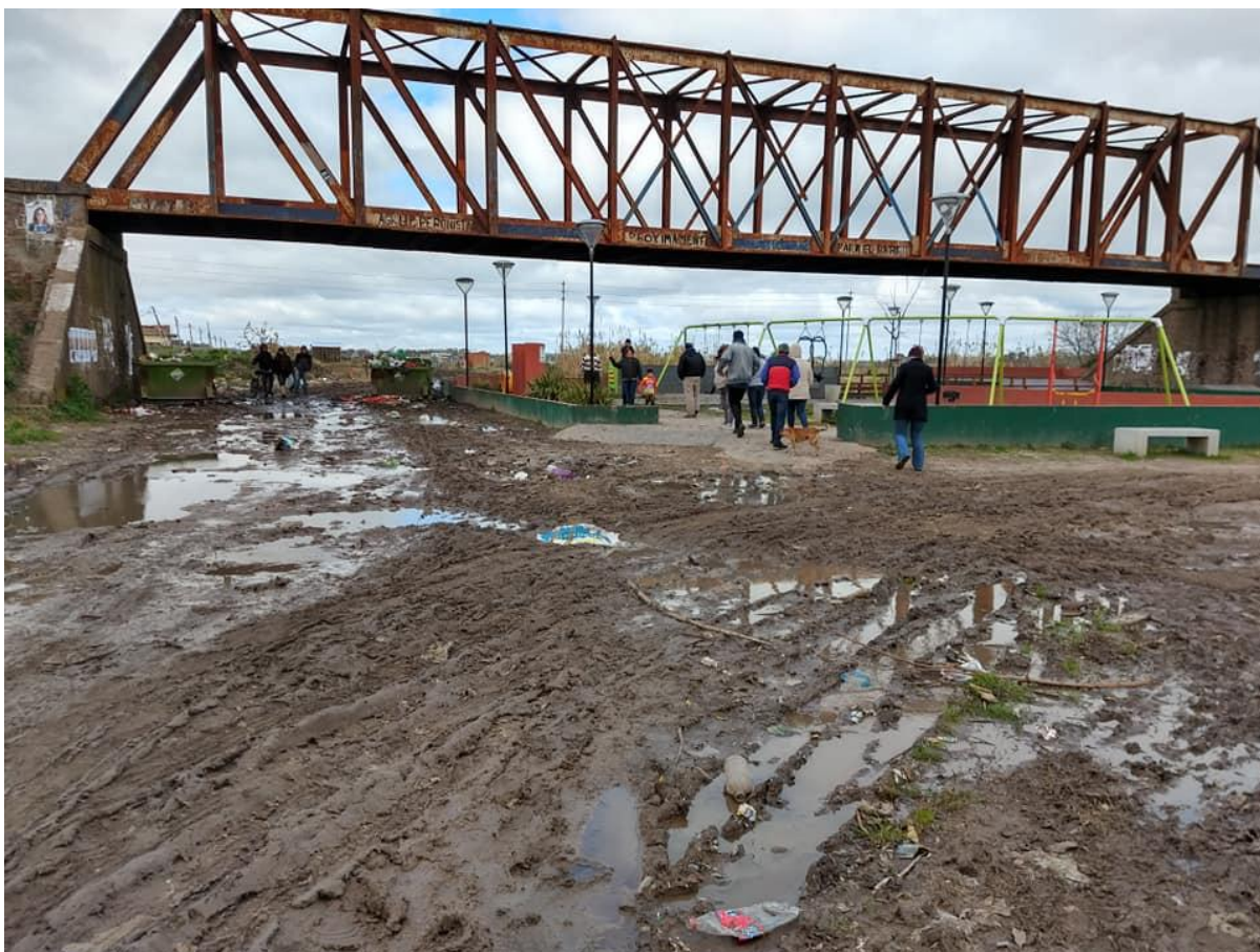
Figura 3: El puente ferroviario en desuso le da nombre al barrio. Debajo se realizó en 2016 la Plaza de la Memoria, con una placa con la consigna de Memoria, Verdad y Justicia por los delitos de lesa humanidad que se cometieron allí durante la última dictadura cívico militar. (Bozzano, 2019)

Con esa información empezó la ocupación y la formación de un barrio que desde el primer momento tenía “mala fama” según dicen sus mismos habitantes. Una señora, de las primeras moradoras, se pregunta “¿Quién es más delincuente? ¿El que ocupa las tierras porque no tiene donde vivir o el que organizaba una sociedad para estafar a posibles compradores?”. Los vínculos con actores políticos están presentes desde los inicios: