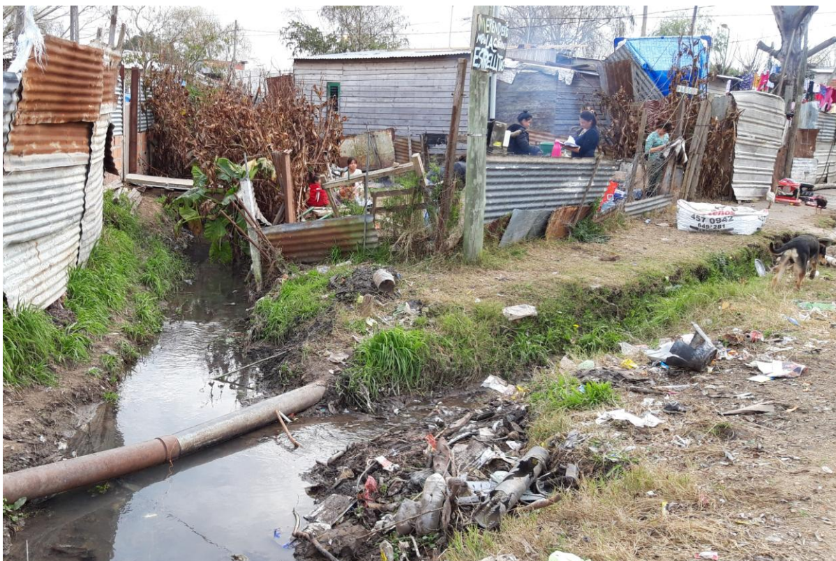
Figura 5: Merendero “Las Estrellitas” (Canevari, 2019)

Existe en la marginalidad urbana una distancia institucional. Esta situación suele suplirse con las estructuras internas de solidaridad y el apoyo colectivo dentro del territorio. Esa inscripción se fortalece con las organizaciones barriales, que los conectan con el afuera dando signos de integración en lugar de marginalidad a través de actividades, talleres, centros de capacitación y convocatorias para fomentar la participación. En esta búsqueda se presentan tensiones constantes: para “conseguir cosas para el barrio” necesitan promover relaciones con instituciones y actores políticos a la vez que deben cuidar y mantener las estructuras de solidaridad que sostienen la dinámica interna. Así lo expresa la referente de un comedor del barrio: