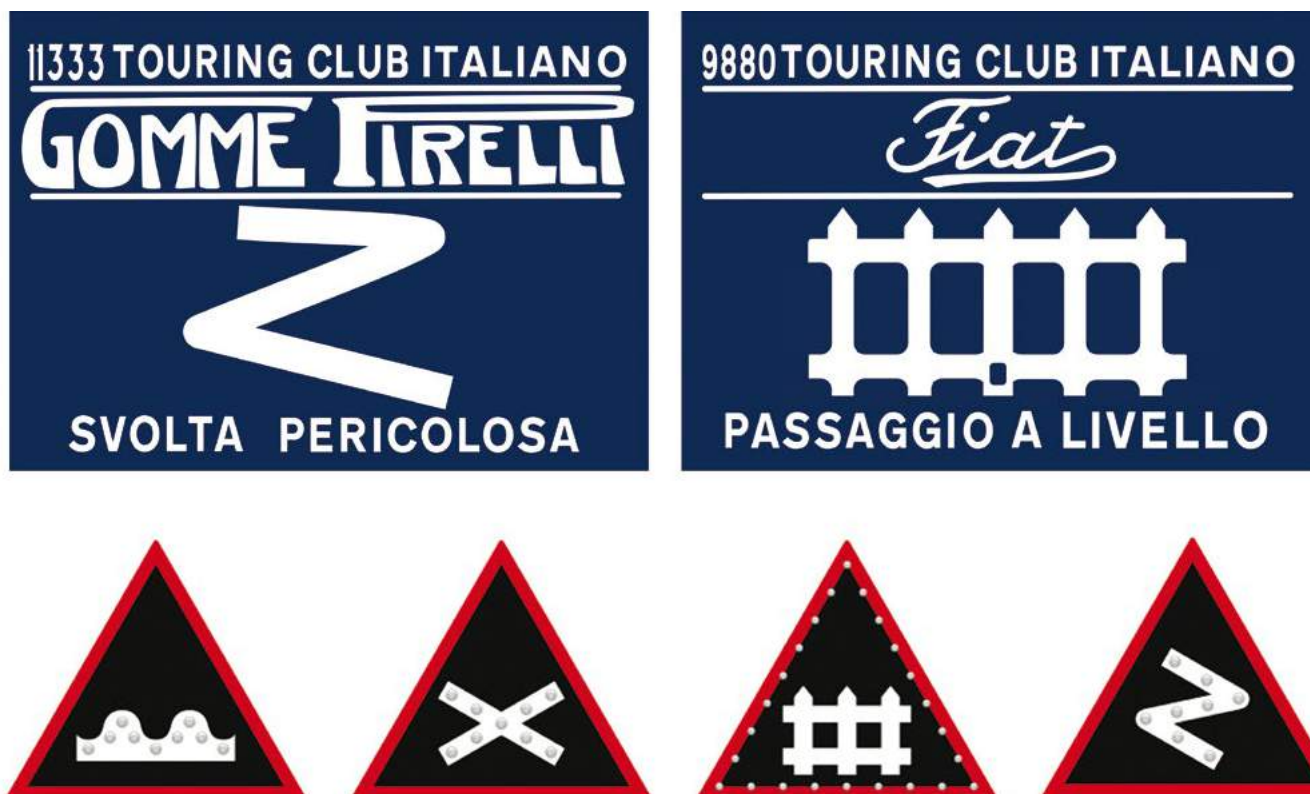
Figura 2. Arriba. Señales viales confeccionadas por el Touring Club. Extraído del sitio Encicliográfica . Abajo. Señales para lugares peligrosos. Extraído del sitio Bookwiki . El contenido de los sitios es libre

aproximadamente 24 000 km de carreteras principales. Durante las tres primeras décadas del siglo XIX se perfeccionaron los métodos de construcción de las carreteras, pero las señales de circulación comenzaron con la difusión del automóvil. El Touring Club de Italia, en 1885, colocó señalizaciones en hierro colado en las que se indicaban situaciones de peligrosidad mediante flechas. En el año 1900, en París, la Liga Internacional de Asociaciones para el Turismo propuso la unificación de las señales de circulación, las cuales fueron aprobadas. Flechas en diferentes posiciones (oblicuas, verticales, curvas) pretendían reemplazar la descripción verbal. Para 1909, se había organizado la primera Conferencia Internacional de Representantes Gubernamentales para tratar los problemas de la circulación, en la que se acordó un convenio al cual cada Estado se comprometía a colocar en cada lugar peligroso, únicamente las señales autorizadas en el Congreso. Se trataba de cuatro pictogramas, aún en uso en la actualidad: doble cuneta, cruce peligroso, paso a nivel con barrera y curva peligrosa [Figura 2].