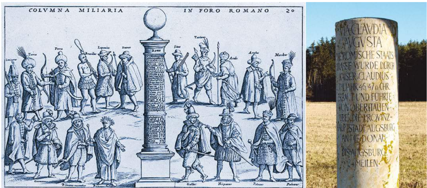
Figura 1. Columna Milliaría. Extraída del sitio Encicliográfica. El contenido de este sitio es de libre uso

Estos millarios eran habitualmente grandes columnas de piedra de una pieza en las que se labraba a cincel y en números romanos los destinos, las distancias, el nombre de la vía y, en muchos casos, el financiador de tan estupenda calzada [Figura 1].