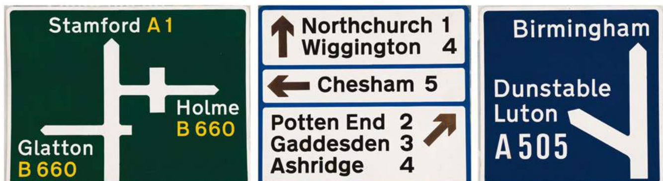
Figura 4. Categorías de señales para el sistema de carreteras de Gran Bretaña

Con el mismo enfoque riguroso para la organización de la información para las señales se compilaron códigos de formas y colores cuidadosamente elegidos que se ajustaban al protocolo celebrado en Ginebra en 1949, en el cual se estableció la utilización de signos triangulares para advertir a los conductores, círculos para dar órdenes, y rectángulos para transmitir información. Establecieron tres categorías de señales: para las autopistas utilizaron letras blancas sobre fondo azul; para las carreteras principales, letras blancas para los nombres y amarillo para los números de las carreteras sobre fondo verde; y para las rutas secundarias, letras en negro sobre fondo blanco [Figura 4].