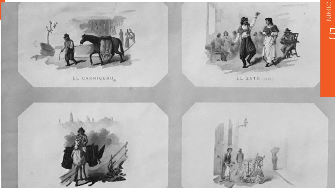
Figura 7. Página del apartado «Costumbres del país» con cuatro ilustraciones: el carnicero, el gato, vendedor de aves, el vaquero. Álbum Vistas y costumbres de Buenos Aires y de la República Argentina (1891). Biblioteca Americana, Archivo Histórico y Museo Mitre