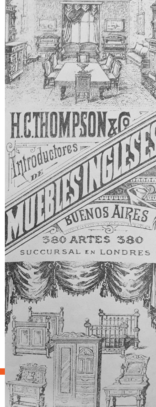
Figura 3. Aviso publicitario de muebles ingleses. Álbum Vistas y costumbres de Buenos Aires y de la República Argentina (1891). Biblioteca Americana, Archivo Histórico y Museo Mitre

El apartado «Costumbres del país» está conformado por un total de ocho ilustraciones [Figuras 6 y 7] ordenadas en una secuencia de cuatro imágenes por página y, a diferencia del primer apartado, no están enmarcadas con publicidades, sino que su fondo es pleno plano. Cada una de las imágenes expone diferentes costumbres y personajes que suponen manifestar actividades típicas como el mate, la danza el gato o el lechero y el aguatero. Es así como el álbum da cuenta de una ruptura en el lenguaje de ambos apartados, donde las imágenes desempeñan un papel determinante en lo que representan y cómo son representadas.