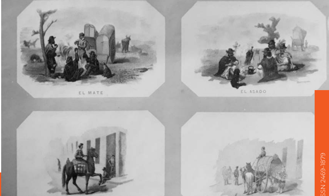
Figura 6. Página del apartado «Costumbres del país» con cuatro ilustraciones: el mate, el asado, el lechero y el aguatero. Álbum Vistas y costumbres de Buenos Aires y de la República Argentina (1891). Biblioteca Americana, Archivo Histórico y Museo Mitre