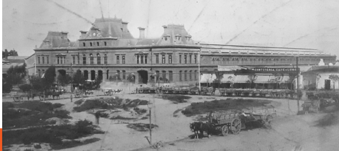
Figura 1. Estación del Ferrocarril del Sud. Álbum Vistas y costumbres de Buenos Aires y de la República Argentina (1891). Biblioteca Americana, Archivo Histórico y Museo Mitre

Del primer apartado se distinguen las fotografías de la estación del Ferrocarril del Sud, actual Estación Constitución [Figura 1] y las residencias de las familias de la elite porteña [Figura 2], donde se destacan las esquinas de las grandes edificaciones, entre otras. Se trata de vistas imponentes de las construcciones de la ciudad en contraste con las calles angostas de la zona comercial.