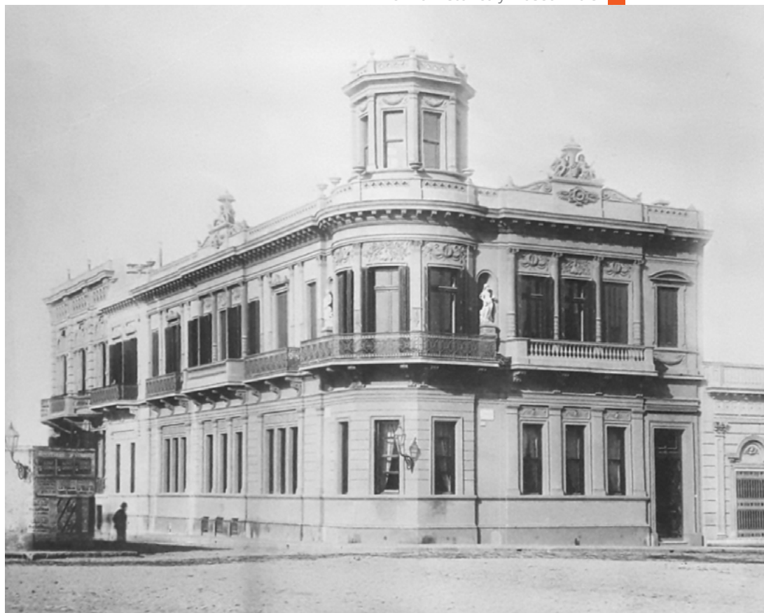
Figura 2. Casa de Ernesto Tornquist (Esq. Florida y Charcas). Álbum Vistas y costumbres de Buenos Aires y de la República Argentina (1891).