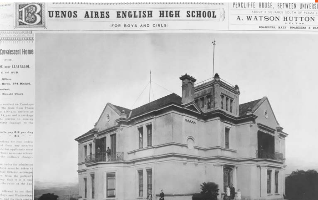
Figura 5. Buenos Aires English High School. Álbum Vistas y costumbres de Buenos Aires y de la República Argentina (1891).