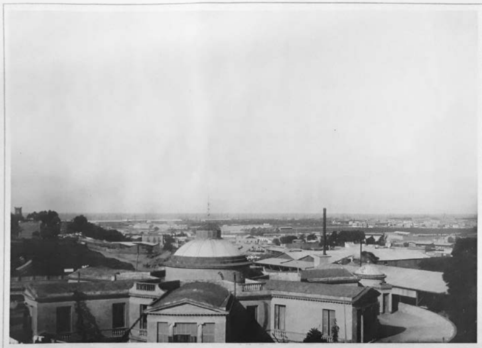
BUENOS AIRES — PARTE SUDESTE CON LA BOCA

Por el contrario, hay otras páginas que tenían fotografías de barrios desde un encuadre más general y un punto de vista contrapicado, sin denotar interés en un edificio en particular. Estas eran acompañadas de publicidades de menor tamaño y sin detalles minuciosos o, incluso, sin publicidad alguna. Un ejemplo de este último es la fotografía de la parte sud de la Boca [Figura 9].