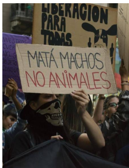
Figura 9. Transfeminismo Antiespecista

En este caso persiste parte del especismo discursivo, a través del término hembras , utilizado comúnmente para referirse a animales no humanos, pero aquí está asociado a otro término que se refiere, por lo general a individuos con el rasgo [+humano]: explotación.