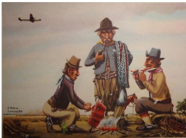
Figura 4. Molina Campos

De acuerdo con la propuesta de Kress & van Leeuwen (2006), en el análisis de la función Ideacional se evidencia a los actores humanos involucrados en procesos transactivos materiales, es decir, procesos accionales que tienen un efecto en un animal no humano. En las figuras 1 y 3, la agencia humana se ejerce sobre los animales de forma violenta: golpear y tirar de una cuerda para dominar y controlar. En la figura 2, aunque no parezca violento aún implica dominación, los animales son mano de obra guiados por un actor humano. Según estos autores podemos decir que hay dos agentes: el Gaucho realiza un proceso en el animal que a su vez lleva a cabo otro proceso: empujar, saltar, etc. En la figura 4 el proceso involucrado se puede considerar de dos maneras diferentes: