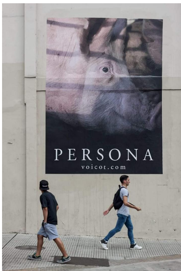
Figura 7. Voicot

marco solo refuerza su significado. Para salir de un significado dominante, debemos cambiar de marco, es decir, entrar en un marco en el que las interpretaciones dominantes de los signos no estén presentes. Por ejemplo, dentro de La Historia de la Carne, los animales denominados de cría son considerados ganado , alimento , y jamás se les otorgaría el status de persona . En la imagen 7 vemos como la ONG Voicot sale del marco dominante al presentar la representación de un cerdo junto con la palabra persona , presentando una nueva interpretación del signo “cerdo”.