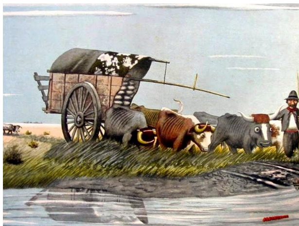
Figura 2. Molina Campos