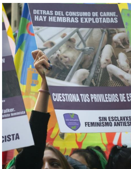
Figura 8. Transfeminismo Antiespecista

En este caso persiste parte del especismo discursivo, a través del término hembras , utilizado comúnmente para referirse a animales no humanos, pero aquí está asociado a otro término que se refiere, por lo general a individuos con el rasgo [+humano]: explotación.