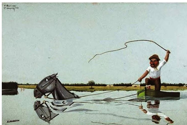
Figura 1. Molina Campos