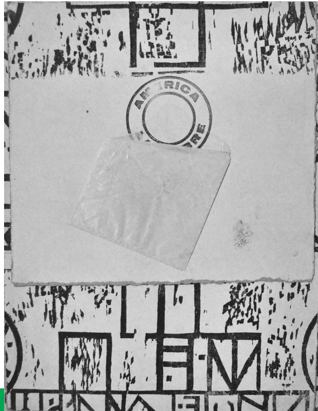
Figura 3. Anverso de la carpeta del catálogo de la Maratón de Antihéroes (1988), Compañía de la Tierra Malamada.

Así, el papel se convirtió en uno de los aliados de la Compañía, ya que era un material cotidiano que permitía la reproducción de sus escritos a máquina o impresiones xilográficas a muy bajo costo. Además, la intervención de este soporte fue crucial para el intercambio de artecorreo y, por lo tanto, para el sellado de sobres y obras.